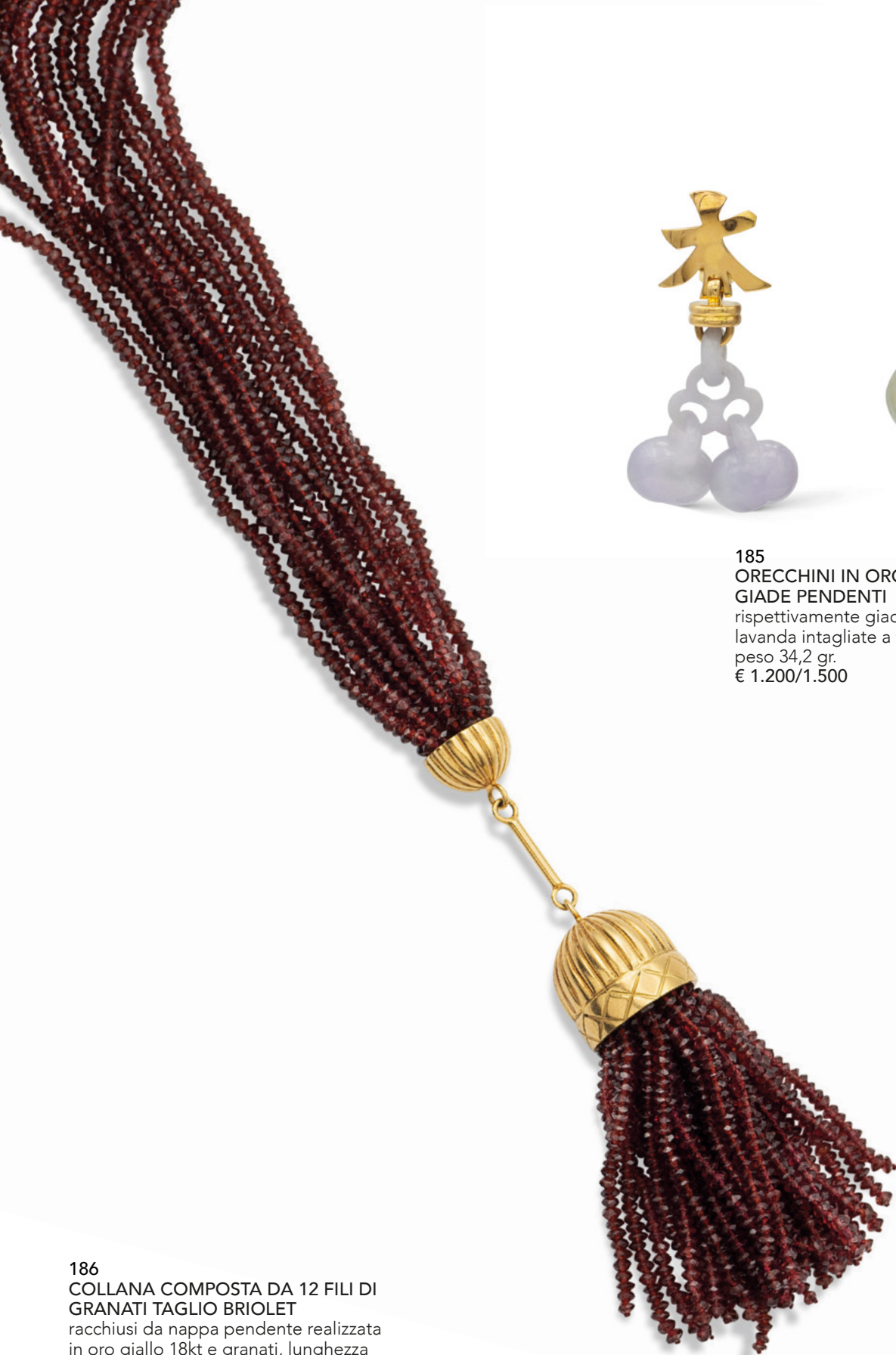
186 COLLANA COMPOSTA DA 12 FILI DI GRANATI TAGLIO BRIOLET racchiusi da nappa pendente realizzata in oro giallo 18kt e granati, lunghezza completa 53 cm. peso 233 gr. € 1.400/1.800