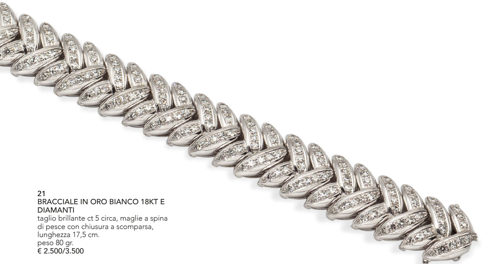
21 BRACCIALE IN ORO BIANCO 18KT E DIAMANTI taglio brillante ct 5 circa, maglie a spina di pesce con chiusura a scomparsa, lunghezza 17,5 cm. peso 80 gr. € 2.500/3.500