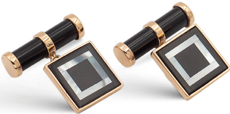
120 GEMELLI QUADRATI IN ORO ROSA 18KT ONICE NERO E MADREPERLA peso 8,5 gr. € 400/600