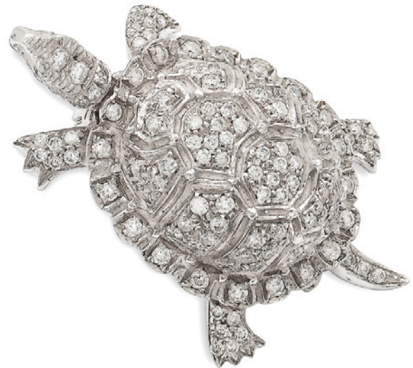
2 SPILLA TARTARUGA IN ORO BIANCO 18KT E DIAMANTI taglio brillante ct 2 circa, testa e coda snodabili peso 16,3 gr. € 1.000/1.500