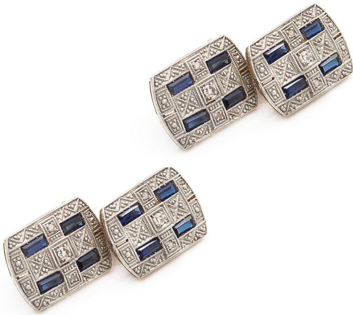
113 GEMELLI RETTANGOLARI IN PLATINO, ORO GIALLO, DIAMANTI E ZAFFIRI anni 30/40 taglio baguettes peso 9,5 gr. € 600/800