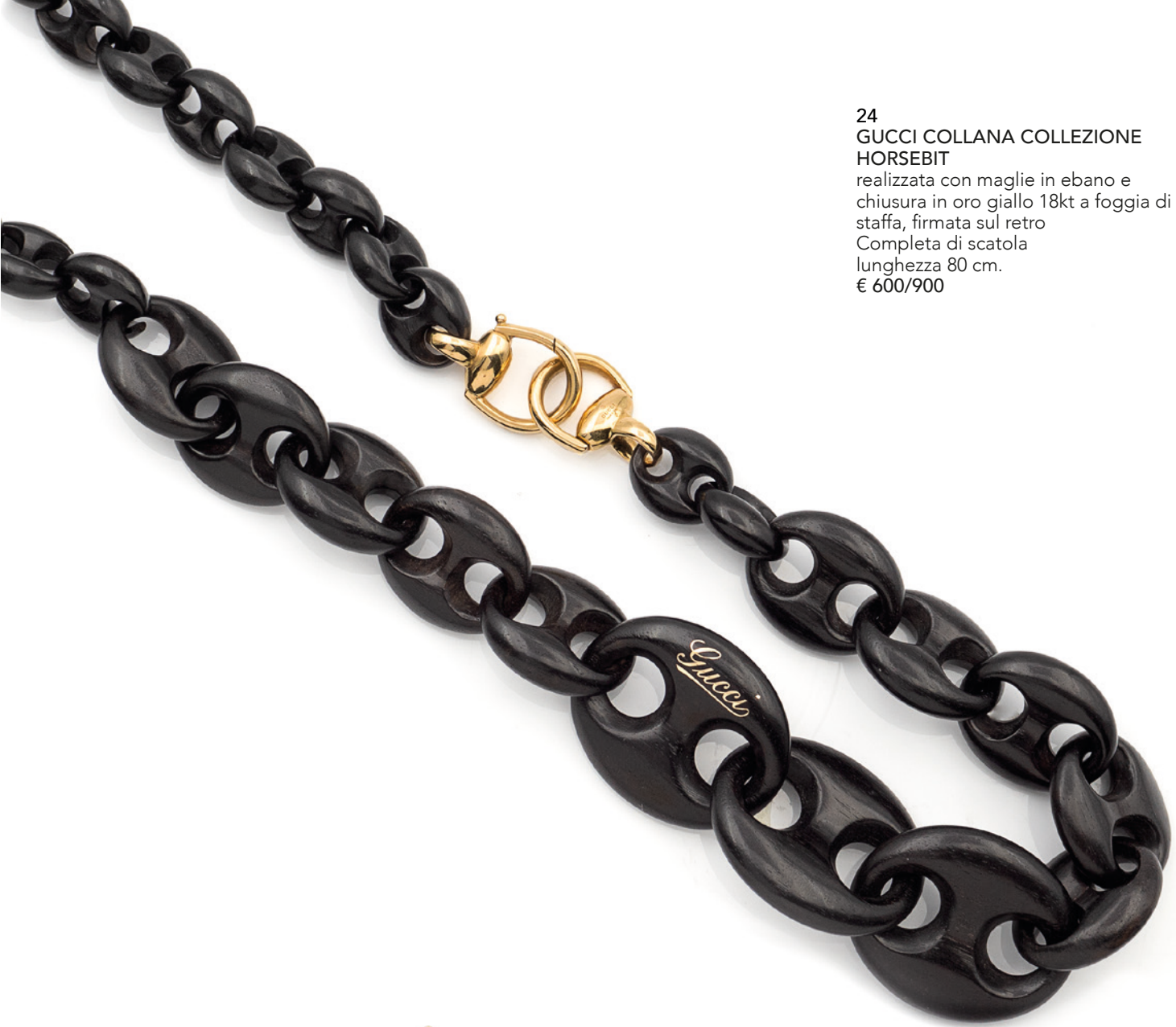
24 GUCCI COLLANA COLLEZIONE HORSEBIT realizzata con maglie in ebano e chiusura in oro giallo 18kt a foggia di staffa, firmata sul retro Completa di scatola lunghezza 80 cm. € 600/900