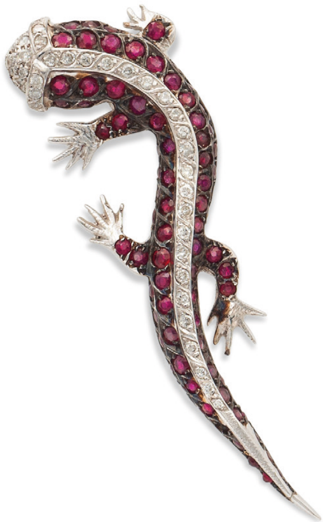
7 SPILLA GECO IN ORO BIANCO 18KT CON RUBINI E DIAMANTI ct 4 circa, alternati da diamanti taglio brillante ct 1 circa, un rubino mancante peso 21 gr. € 1.000/1.500