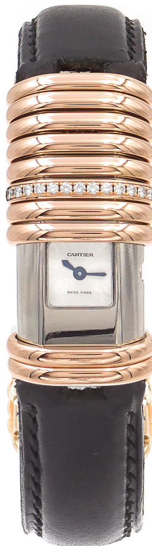
94 CARTIER DECLARATION, OROLOGIO DA DONNA anni 2000 cassa rettangolare 16x39 mm. in oro rosa 18kt, titanio e diamanti taglio brillante, ref. 2611 - 62179CE, quadrante argentato a raggiera nascosto, vetro zaffiro, movimento al quarzo, cinturino originale in pelle con fibbia deployante in oro rosa 18kt, cassa, quadrante e movimento firmati Completo di scatola € 3.000/4.000