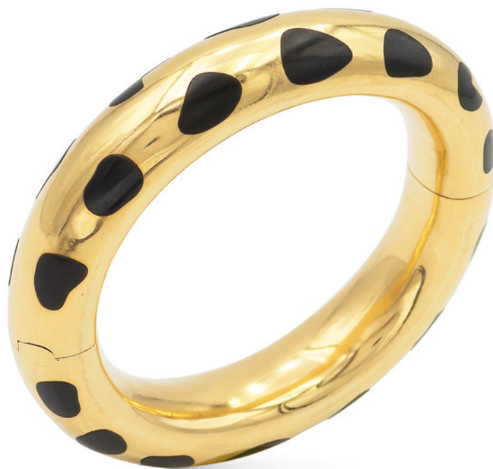
58 TIFFANY & CO. BRACCIALE A MANETTA IN ORO GIALLO 18KT E ONICE NERO anni 70/80 tagliato a sezioni fantasia, firmato all'interno della cerniera inferiore peso 80 gr. € 4.000/6.000