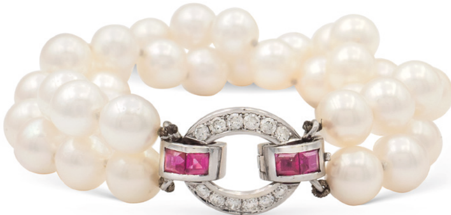
169 BRACCIALE A DUE FILI DI PERLE COLTIVATE di 7 mm. circa, chiusura a ponte in oro bianco 18kt con diamanti taglio brillante ct 0,25 circa e rubini taglio brillante ct 0,40 circa, lunghezza 17 cm. peso 24,2 gr. € 300/400