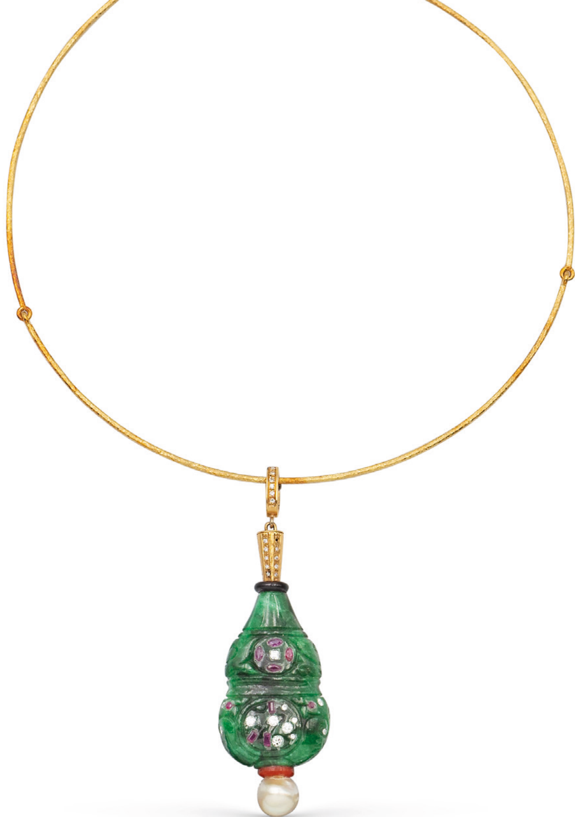
184 PENDENTE IN GIADA INCISA CON DIAMANTI E RUBINI firmato Sacchi ct 0,40 circa, montato in oro giallo 18kt con sezioni in onice nero, corallo e perla, completo di golino in oro giallo 18kt, lunghezza 40 cm. un brillante mancante peso 37,6 gr. € 800/1.200