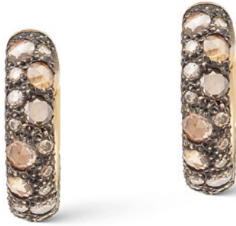
31 POMELLATO, ORECCHINI COLLEZIONE TANGO piccoli cerchi in oro rosa 18kt e diamanti taglio brillante briolet colore brown ct 1,60 circa, firmati e numerati all'interno n. C80004004488 peso 10 gr. € 800/1.200