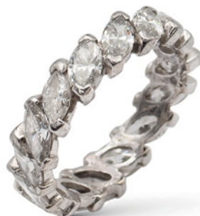
68 ANELLO FEDE IN PLATINO E DIAMANTI anni 40/50 taglio marquise ct 3 circa, misura 16 peso 4 gr. € 1.500/2.000