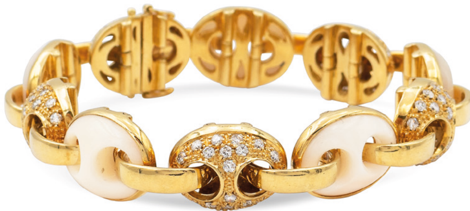
188 BRACCIALE SNODABILE IN ORO GIALLO 18KT anni 70/80 maglie ovali con diamanti taglio brillante ct 1,80 circa alternate a maglie con agate, chiusura a scomparsa, lunghezza 17 cm . peso 54,5 gr. € 1.800/2.200