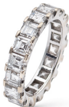
19 ANELLO FEDE IN ORO BIANCO E DIAMANTI taglio princess ct 3,20 circa, misura 12 peso 4,2 gr. € 1.500/2.000