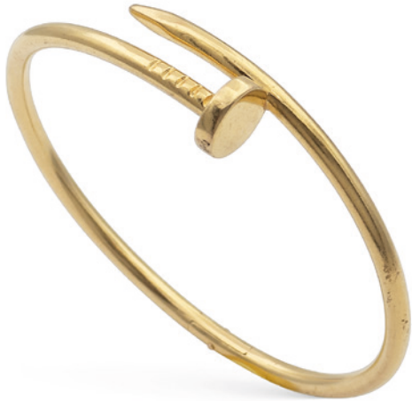
92 CARTIER, BRACCIALE "JUST UN CLOU" in oro giallo 18kt a manetta, firmato all'interno, diametro 5,5 cm. Completo di scatola peso 23,5 gr. € 900/1.200