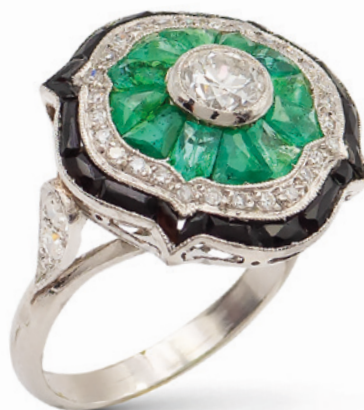
133 ANELLO DECÒ IN PLATINO CON UN DIAMANTE TAGLIO BRILLANTE ANTICO anni 30/40 ct 0,40 circa contornato da smeraldi taglio tapered, diamanti taglio brillante e sezioni in onice nero, misura 15 peso 8,2 gr. € 2.500/3.000