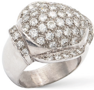
145 ANELLO BOMBÉ IN PLATINO E DIAMANTI anni 50/60 taglio brillante ct 1,80 circa, misura 16,5 peso 14,7 gr. € 1.700/2.000