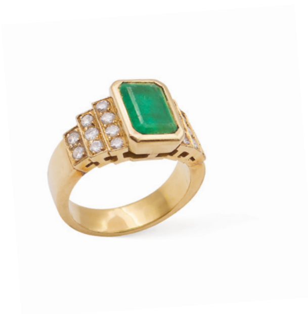
210 ANELLO IN ORO GIALLO 18KT CON SMERALDO anni 40/50 taglio smeraldo ottagonale ct 3,5 circa, ai lati diamanti taglio brillante ct 0,40 circa, misura 20 peso 12,8 gr. € 800/1.000