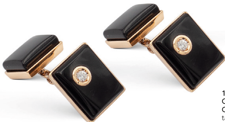
118 GEMELLI DOPPI IN ORO ROSA 18KT, ONICE NERO E DUE DIAMANTI taglio brillante incastonati ct 0,10 circa peso 8,2 gr. € 400/600