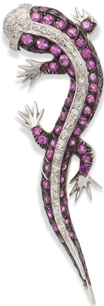
5 SPILLA GECO IN ORO BIANCO 18KT CON ZAFFIRI ROSA E DIAMANTI ct 4 circa alternati da diamanti taglio brillante ct 1 circa, uno zaffiro mancante peso 20 gr. € 1.000/1.500