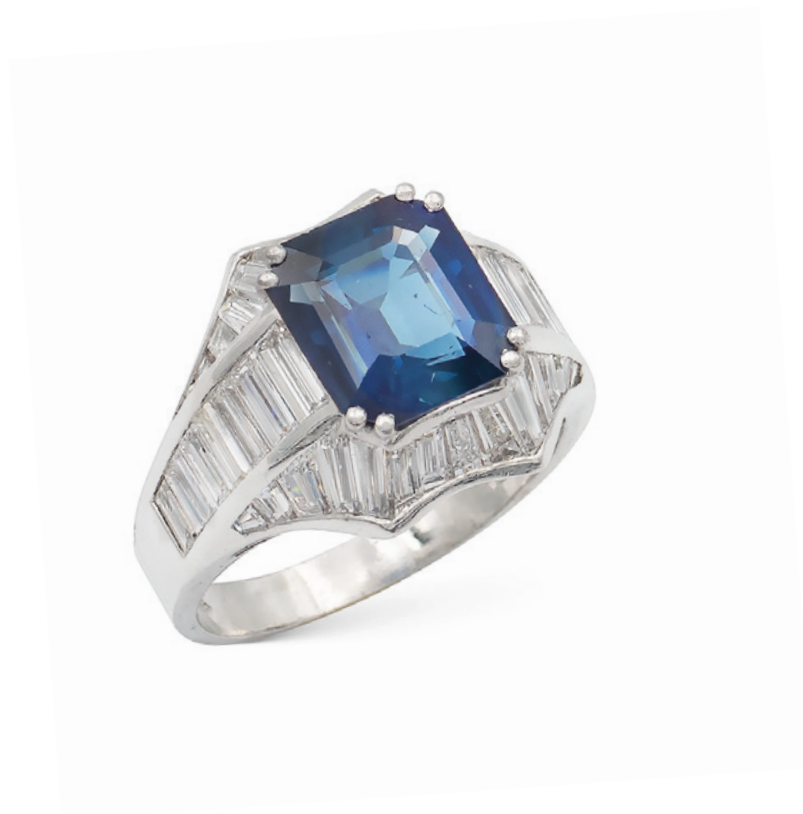
40 ANELLO IN ORO BIANCO 18KT CON ZAFFIRO NATURALE CT 5 circa, origine Sri Lanka, ai lati diamanti taglio baguettes ct 2,40 circa colore G/H - purezza VVS-VS Completo di certificato gemmologico del Dott. Maurizio Martini n. 14Z-20-An peso gr. 10,6 € 6.000/8.000