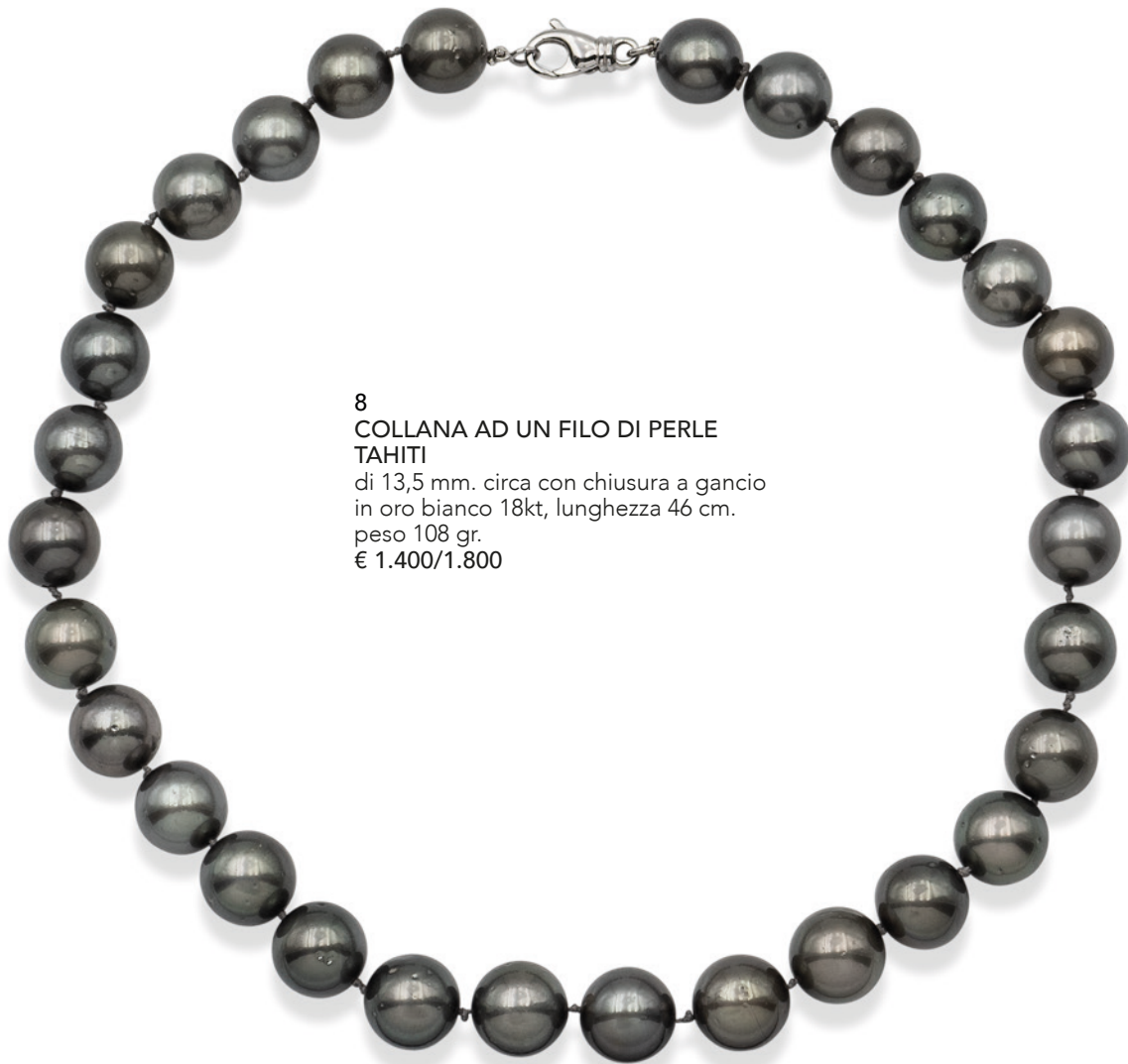
8 COLLANA AD UN FILO DI PERLE TAHITI di 13,5 mm. circa con chiusura a gancio in oro bianco 18kt, lunghezza 46 cm. peso 108 gr. € 1.400/1.800