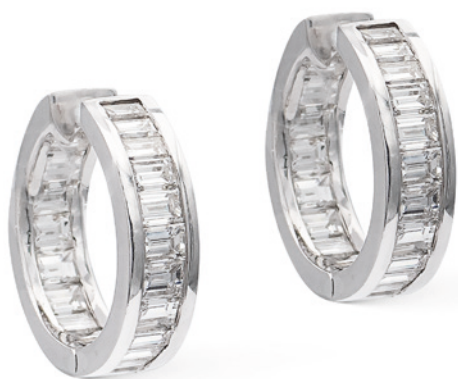
18 ORECCHINI CERCHI IN ORO BIANCO 18KT E DIAMANTI diamanti taglio carré ct 2 circa peso 7,8 gr. € 500/800