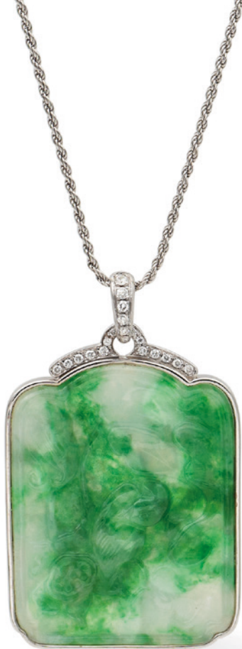
48 PENDENTE IN GIADA SCOLPITA A MOTIVI NATURALISTICI su entrambi i lati entro cornice in oro bianco 18kt e diamanti taglio brillante ct 0,40 circa, completo di collanina in oro bianco 18kt a cordoncino, lunghezza 43 cm. peso 22,2 gr. € 700/1.000