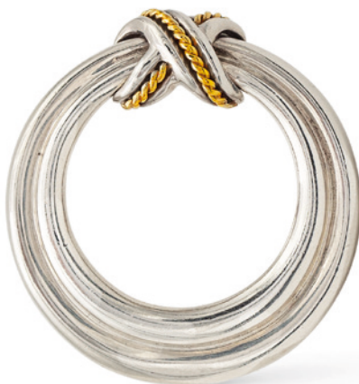
220 TIFFANY, SPILLA COLLEZIONE GRIFFE PER BACIO realizzata in argento e oro giallo, firmata sul retro Completa di custodia in tessuto peso 9,7 gr. € 50/100