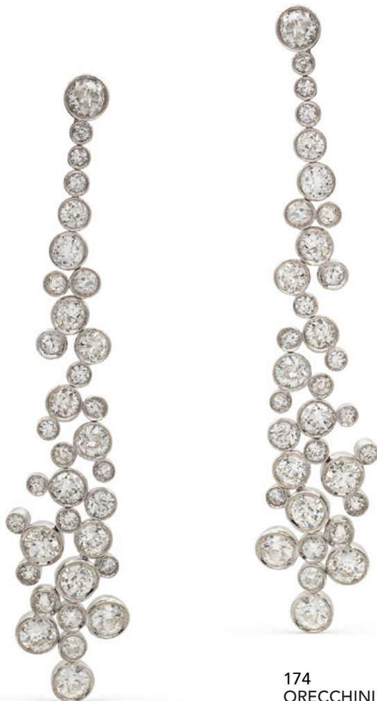
174 ORECCHINI PENDENTI IN ORO BIANCO 18KT E DIAMANTI taglio brillante antico ct 12,50 circa disposti a cascata peso 26 gr. € 6.000/8.000