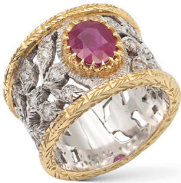
52 ANELLO A FASCIA CON RUBINO NATURALE CT 1,60 circa taglio ovale briolet montato in oro a due colori 18kt ai lati diamanti taglio brillante ct 0,55 circa, misura 14 peso 13,2 gr. € 1.500/2.000