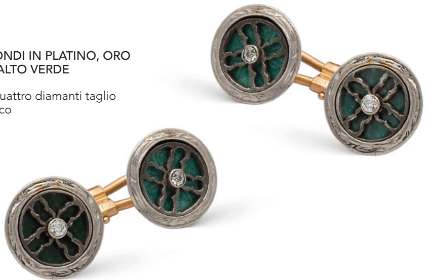
114 GEMELLI TONDI IN PLATINO, ORO ROSA E SMALTO VERDE anni 30/40 centrati da quattro diamanti taglio brillante antico peso 14,5 gr. € 600/800