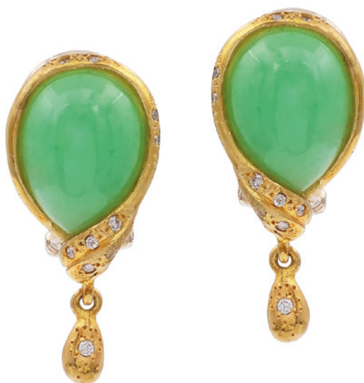
183 ORECCHINI IN ORO GIALLO 18KT E GIAD E OVALI firmati D'Avossa taglio cabochon impreziosite da due pépite pendenti in oro e da diamanti taglio brillante ct 0,20 circa peso 18 gr. € 600/800