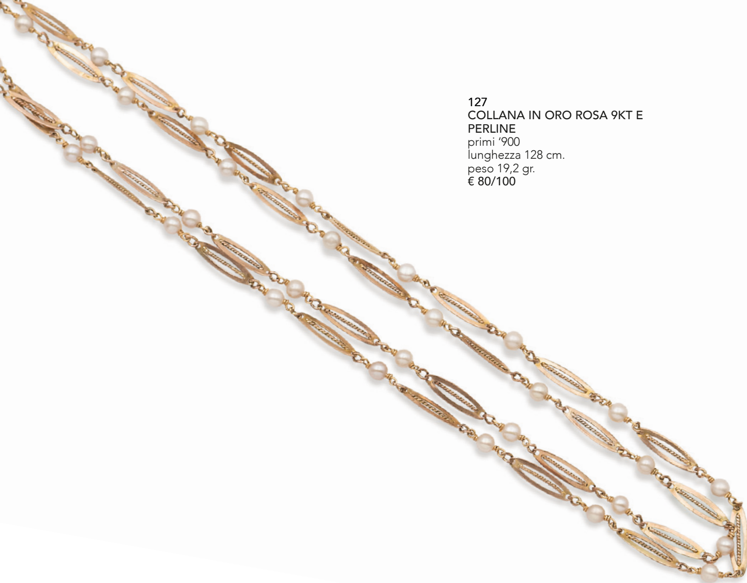
127 COLLANA IN ORO ROSA 9KT E PERLINE primi '900 lunghezza 128 cm. peso 19,2 gr. € 80/100