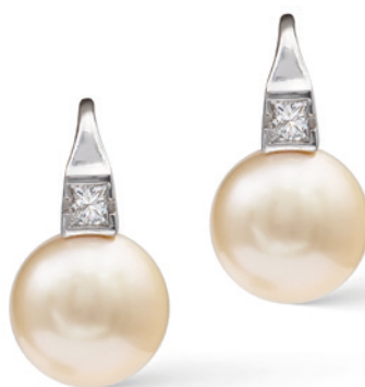
38 ORECCHINI A MONACHINA IN ORO BIANCO 18KT E DUE PERLE GOLD SOUTH SEA di 12,2 mm. ct 26,47 circa e due diamanti taglio brillante ct 0,36 circa peso 10,2 gr. € 600/800