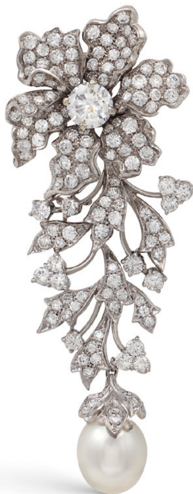
64 SPILLA RAMAGE FLOREALE IN ORO BIANCO 18KT anni 50/60 fiore centrato da un diamante taglio brillante ct 1 circa, altri diamanti taglio brillante ct 3,50 circa e perla pendente di 10,5 mm. peso 20,8 gr. € 2.000/2.500