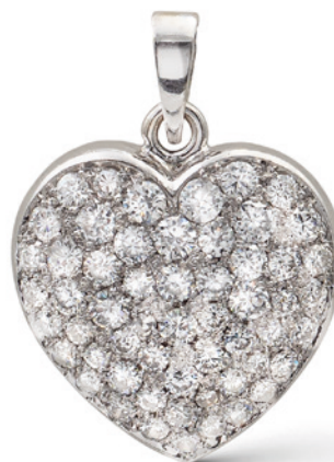
49 PENDENTE CUORE IN ORO BIANCO CON PAVÉ DI DIAMANTI taglio brillante ct 1,80 circa peso 5,4 gr. € 700/1.000