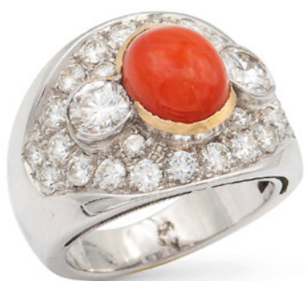
45 ANELLO IN ORO BIANCO E GIALLO 18KT CON CORALLO E DIAMANTI centrato da un corallo rosso taglio cabochon, ai lati due diamanti taglio brillante ct 0,80 circa e altri diamanti ct 1,20 circa, misura 15 peso 14,9 gr. € 1.700/2.000