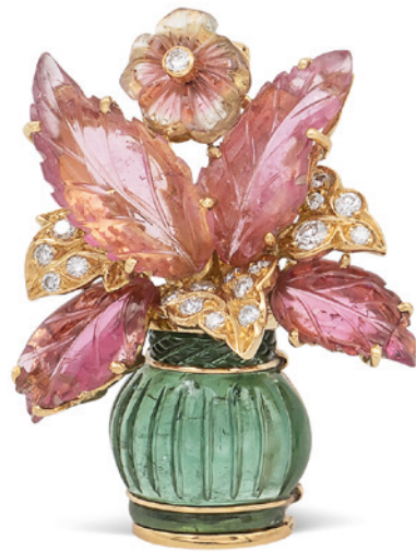
53 SPILLA CESTINO DI FIORI IN ORO GIALLO 18KT E TORMALINE anni 50/60 nelle tonalità del verde e rosa alternate a diamanti taglio brillante ct 0,30 circa peso 17,4 gr. € 300/500