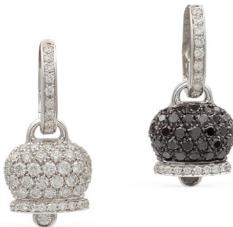
9 CHANTECLER, ORECCHINI COLLEZIONE CAMPANELLE Capri in oro bianco 18kt, diamanti taglio brillante e diamanti neri ct 3,50 circa, firmati sul retro peso 11 gr. € 1.400/1.800