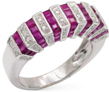
20 ANELLO RIVIÈRE IN PLATINO DIAMANTI E RUBINI diamanti taglio brillante ct 0,15 circa alternati da rubini taglio carré disposti a gradazione ct 1,50 circa, misura 17 peso 7,5 gr. € 1.200/1.500