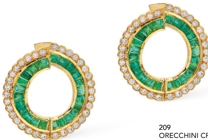
209 ORECCHINI CREOLE IN ORO GIALLO 18KT diamanti taglio brillante ct 1,20 circa e smeraldi taglio tapered 1,50 circa peso 8,3 gr. € 500/800