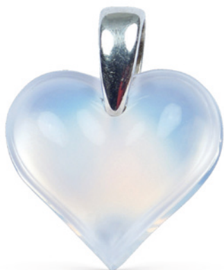
219 LALIQUE, PENDENTE A CUORE COLLEZIONE AMOUREUSE BEAUCOUP in argento e vetro opalescente, firmato sul retro peso 2,7 gr. Offerta Libera