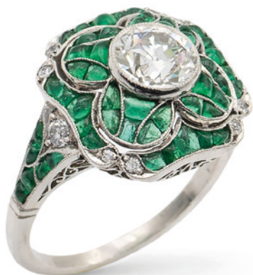
132 ANELLO DECÒ IN PLATINO CON UN DIAMANTE CT 1 anni 30/40 circa taglio brillante antico contornato da smeraldi taglio cabochon fantasia e diamanti taglio brillante, misura 14 peso 6 gr. € 3.000/4.000