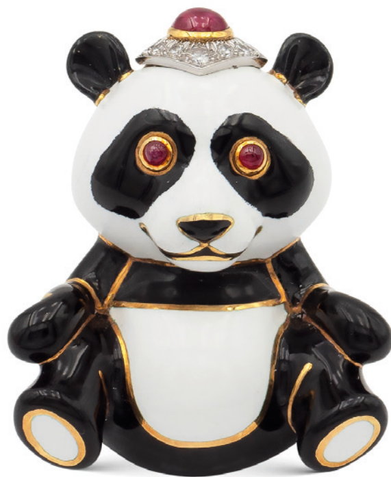
60 DAVID WEBB, SPILLA "PANDA" IN ORO GIALLO 18KT E PLATINO anni 70/80 stesura di smalto bianco e nero, parte superiore centrata da un rubino taglio cabochon contornato da diamanti taglio brillante e occhi con rubini cabochon peso 47,7 gr. € 4.000/6.000