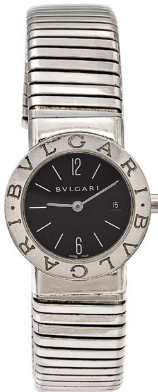
79 BULGARI, OROLOGIO TUBOGAS IN ACCIAIO anni 2000 cassa 26 mm. ref. BB26TS - D312715, quadrante nero con indici e numeri arabi, datario ore 3, vetro zaffiro, movimento al quarzo, bracciale tubogas a manetta in acciaio, cassa, quadrante e movimento firmati. Completo di scatola diametro 6 € 700/1.000