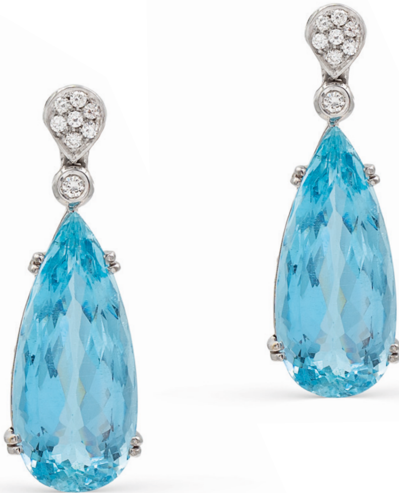
39 ORECCHINI IN ORO BIANCO 18KT E DUE ACQUAMARINE NATURALI CT 42 circa taglio a goccia briolet contornate e sormontate da diamanti taglio brillante ct 1,50 circa peso 16,9 gr. € 3.500/4.500