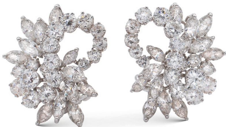
67 ORECCHINI A MOTIVO FLOREALE IN ORO BIANCO 18KT E DIAMANTI anni 50/60 taglio brillante e marquise ct 4 circa peso 14,1 gr. € 2.800/3.500