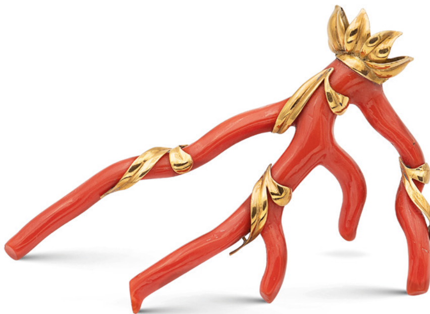
176 SPILLA RAMO CORALLO ROSSO montata in oro giallo 18kt peso 31 gr. € 400/600