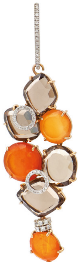
202 ORECCHINI PENDENTI IN ORO ROSA E BIANCO 18KT citrini fumé e corniola taglio fantasia impresiositi da diamanti taglio brillante ct 1 circa peso 22,8 gr. € 900/1.200