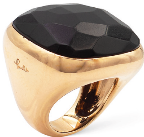
30 POMELLATO, ANELLO COLLEZIONE VICTORIA in oro rosa con Jet nero sfaccettato, firmato sul gambo, misura 13 peso 32,7 gr. € 2.000/3.000