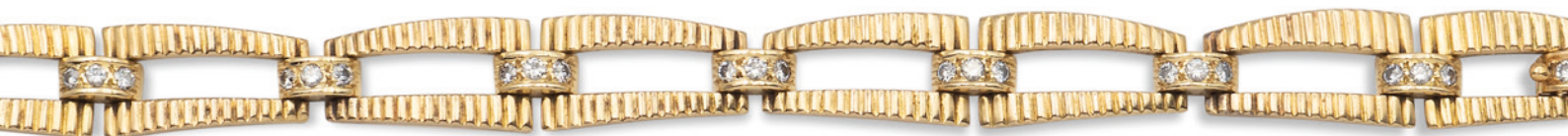
163 BRACCIALE IN ORO GIALLO 18KT anni 50/60 maglie a motivo geometrico alternate da elementi a ponte in oro giallo e diamanti taglio brillante ct 0,60 circa, chiusura a scomparsa, lunghezza 16,5 cm. peso 37,6 gr. € 1.000/1.500