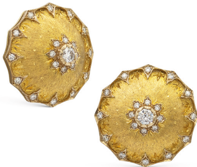
62 MARIO BUCCELLATI, ORECCHINI IN ORO GIALLO 18KT E DIAMANTI centrati da due diamanti taglio brillante ct 0,20 circa ciascuno contornati da altri diamanti ct 0,80 circa, firmati sul retro peso 24,7 gr. € 3.500/4.500