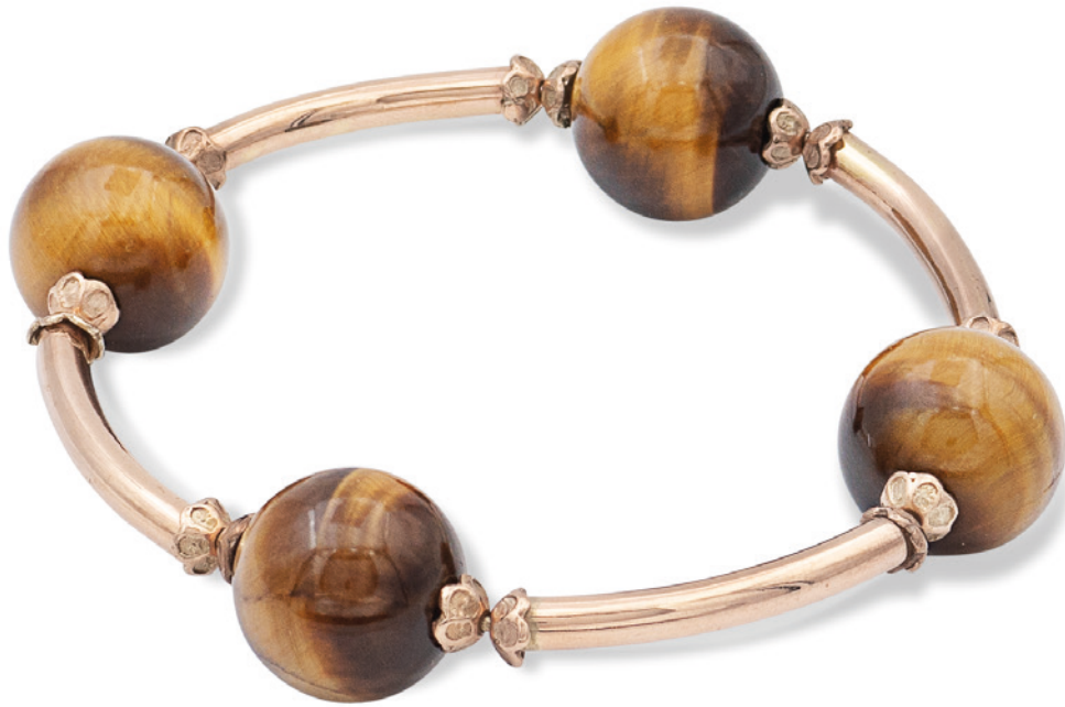
155 BRACCIALE MANETTA IN ORO ROSA 18KT anni 40/50 maglia tubolare alternata da boule in occhio di tigre, diametro 7 cm. peso 49,7 gr. € 500/800