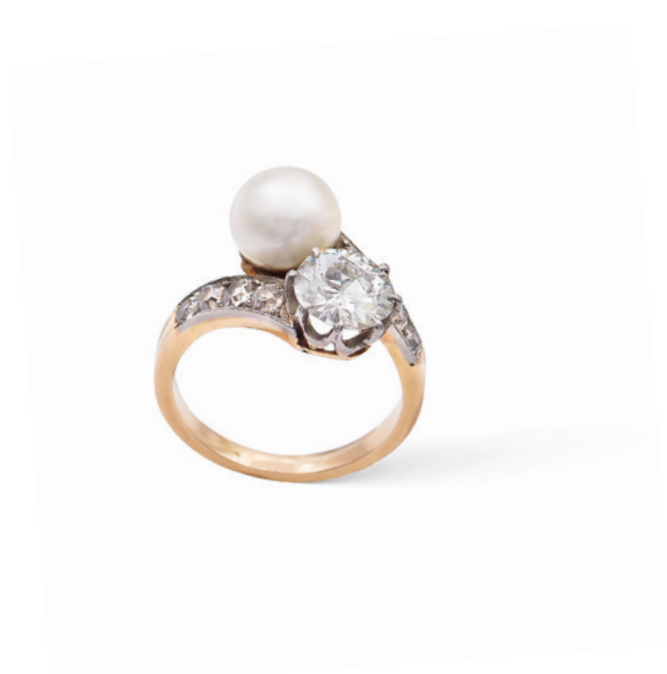
128 ANELLO CONTRARIÈ IN ORO ROSA 18KT E PLATINO CON UNA PERLA NATURALE E UN DIAMANTE anni 30/40 perla ct 2,85 circa - 7,47 circa mm. e un diamante taglio brillante ct 1 circa colore G - purezza VVS e altri diamanti taglio brillante ct 0,50 circa, Completo di certificato gemmologico I.G.N. n. 22697 peso 5,0 gr. € 1.800/2.500