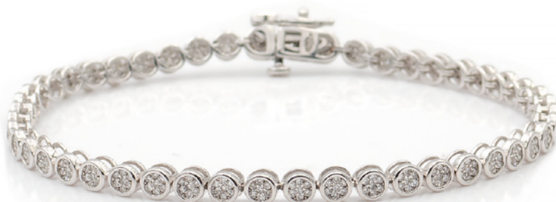
175 BRACCIALE TENNIS IN ORO BIANCO 18KT E DIAMANTI taglio brillante ct 1,70 circa, chiusura a scomparsa lunghezza 18,5 cm. peso 10,8 gr. € 900/1.200