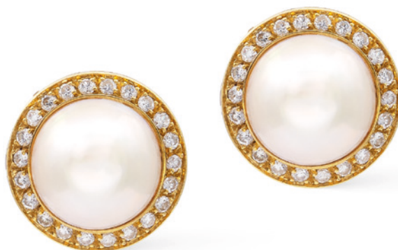
208 ORECCHINI IN ORO GIALLO 18KT PERLE MABÉ E DIAMANTI taglio brillante ct 0,80 circa peso 10,4 gr. € 400/600