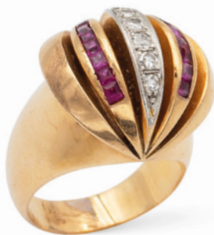
152 ANELLO BOMBÉ IN ORO GIALLO 18KT DIAMANTI E RUBINI anni 40/50 rivière di diamanti taglio brillante ct 0,20 circa, ai lati rubini taglio carré, misura 13 peso 14,3 gr. € 400/600