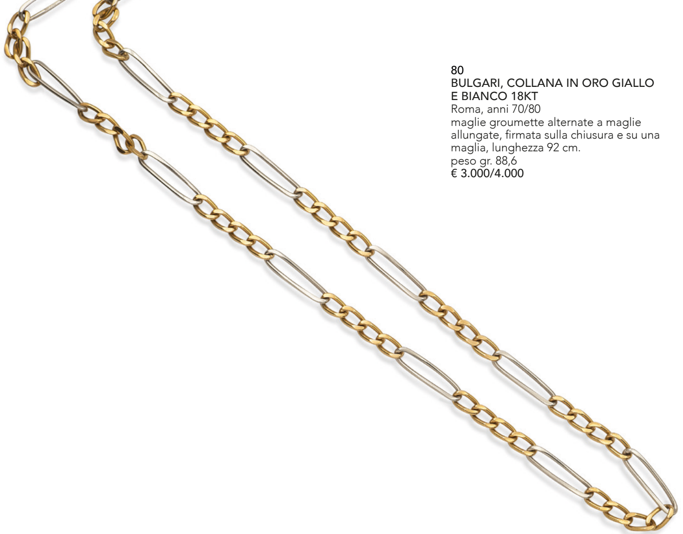
80 BULGARI, COLLANA IN ORO GIALLO E BIANCO 18KT Roma, anni 70/80 maglie groumette alternate a maglie allungate, firmata sulla chiusura e su una maglia, lunghezza 92 cm. peso gr. 88,6 € 3.000/4.000