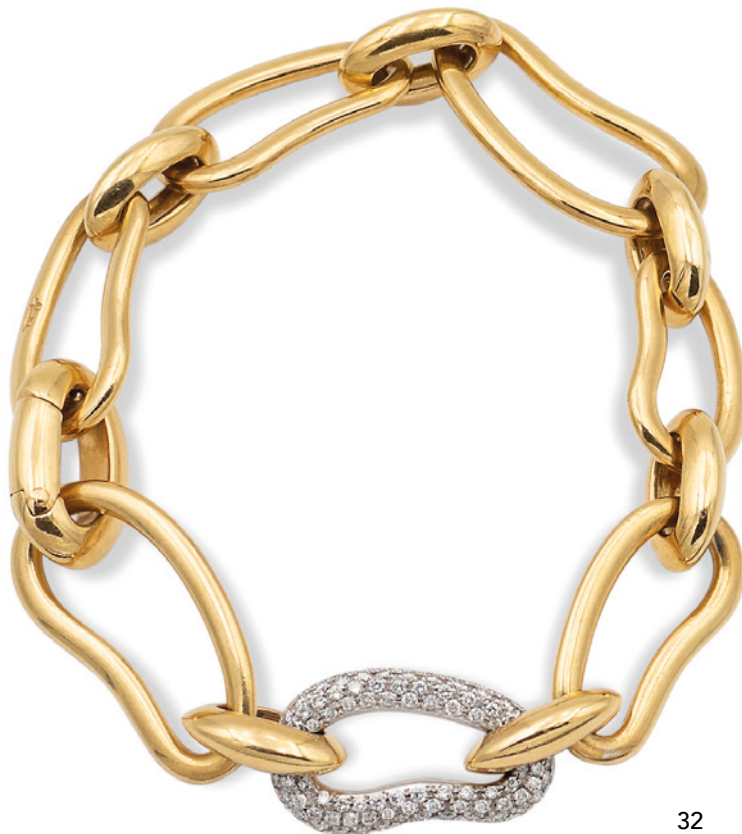
32 POMELLATO, BRACCIALE IN ORO GIALLO 18KT a maglie intrecciate di cui una in oro bianco con diamanti taglio brillante ct 1,20 circa, chiusura a scomparsa, firmato su una maglia, lunghezza 19 cm. Completo di sacchetto in tessuto peso 46,2 gr. € 1.500/1.800