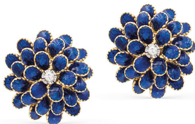
205 ORECCHINI FIORE IN ORO GIALLO 18KT E SMALTO BLU centrati da due diamanti taglio brillante peso 20,8 gr. € 1.200/1.600