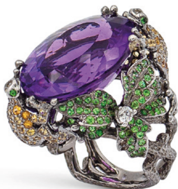
197 ANELLO SCULTURA IN ORO NERO 18KT E AMETISTA taglio ovale briolet contornata da zavorite, zaffiri gialli e diamanti taglio brillante misura 13 peso 26,1 gr. € 1.200/1.500