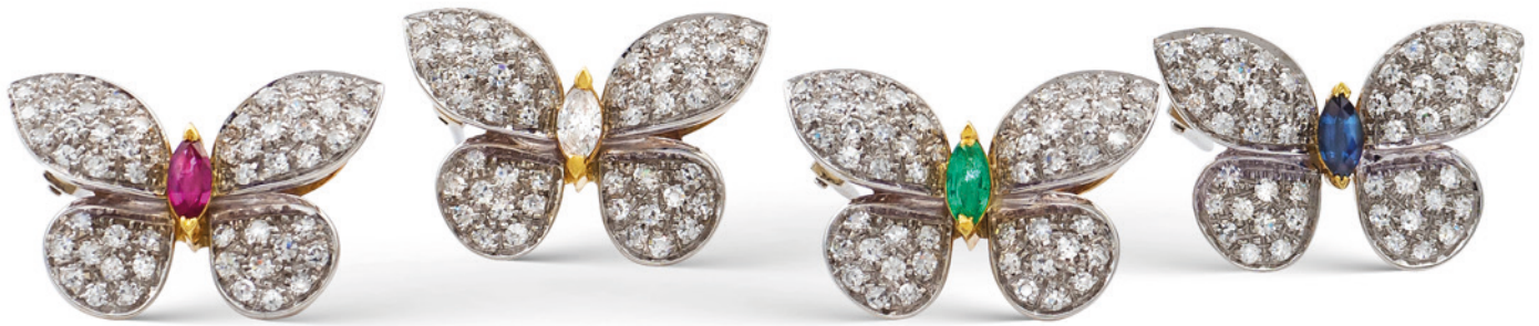
3 QUATTRO SPILLE A FARFALLA IN ORO A DUE COLORI 18KT E DIAMANTI taglio brillante ct 2 circa, centrate rispettivamente da un diamante, un rubino, uno zaffiro e uno smeraldo taglio marquise peso 19,8 gr. € 1.200/1.600