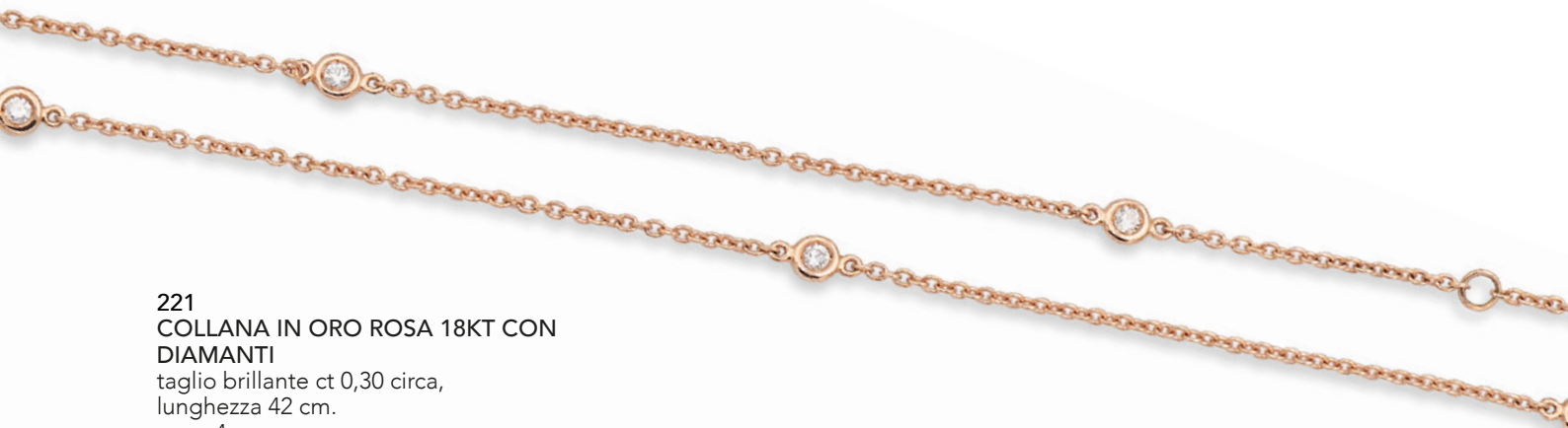
221 COLLANA IN ORO ROSA 18KT CON DIAMANTI taglio brillante ct 0,30 circa, lunghezza 42 cm. peso 4 gr. € 400/600