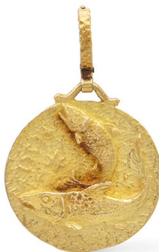
179 PENDENTE SCULTURA IN ORO GIALLO 18KT sculpto a raffigurare due pesci peso 20,4 gr. € 500/700