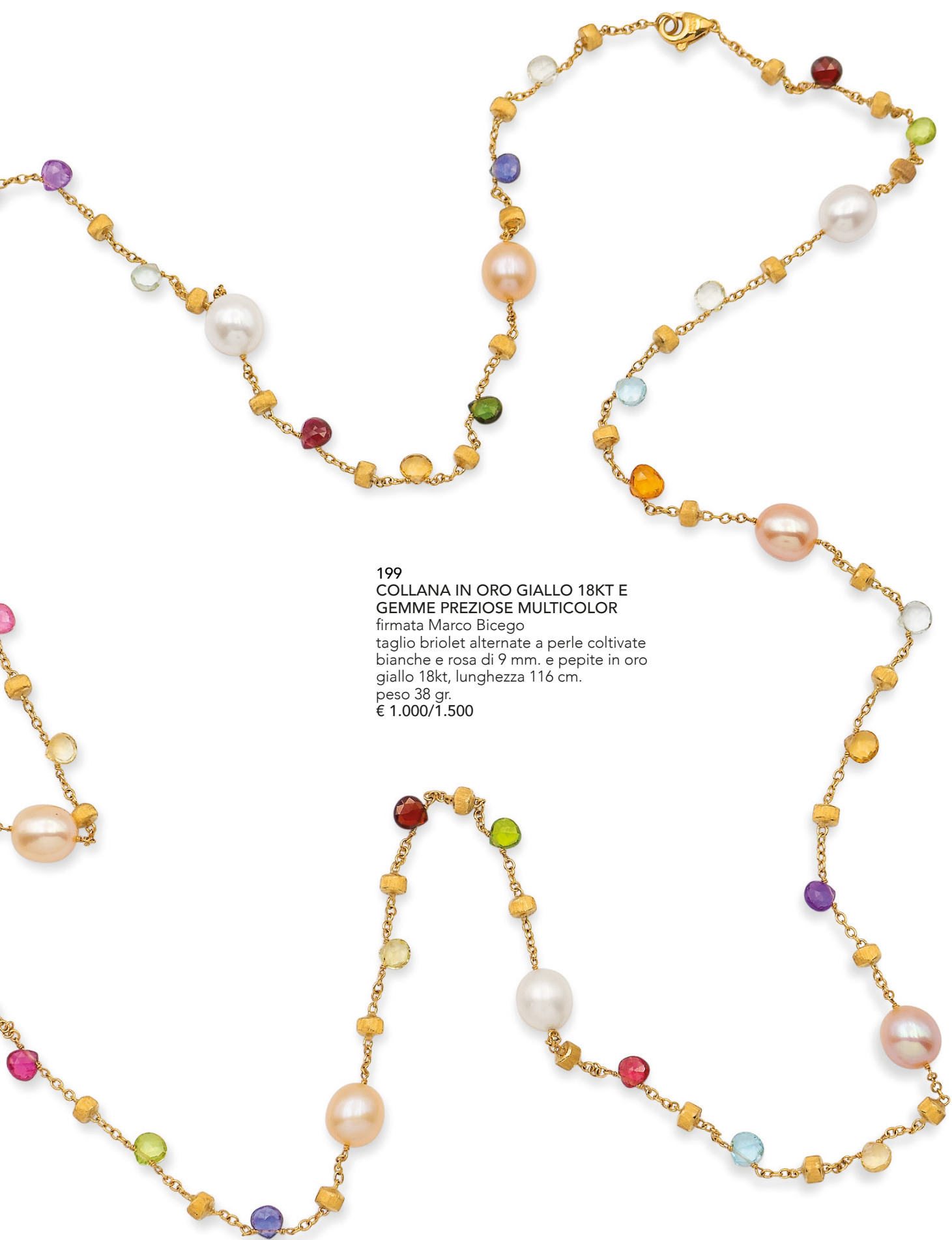
199 COLLANA IN ORO GIALLO 18KT E GEMME PREZIOSE MULTICOLOR firmata Marco Bicego taglio briolet alternate a perle coltivate bianche e rosa di 9 mm. e pepite in oro giallo 18kt, lunghezza 116 cm. peso 38 gr. € 1.000/1.500