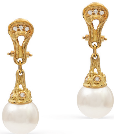
178 ORECCHINI SCULTURA IN ORO GIALLO 18KT CON PERLE GIAPPONESI pendenti di 13 mm. e diamanti taglio brillante ct 0,14 circa peso 15,5 gr. € 700/600