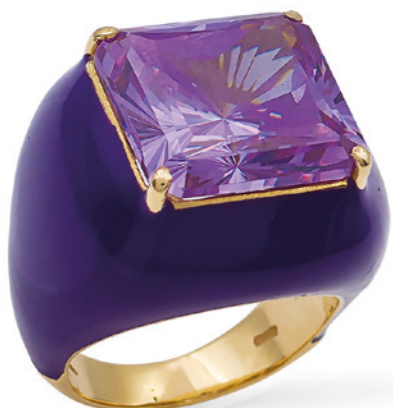
195 ANELLO COCKTAIL IN ORO GIALLO 18KT E SMALTO VIOLA centrato da un ametista taglio carré, lievi difetti, misura 13,5 peso 20,4 gr. € 700/1.000