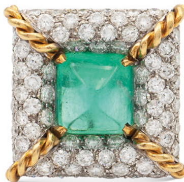
65 ORECCHINI IN ORO BIANCO E GIALLO 18KT CON SMERALDI E DIAMANTI centrati da due smeraldi taglio pan di zucchero ct 10 circa, contornati da diamanti taglio brillante ct 6 circa peso 34,2 gr. € 6.000/8.000