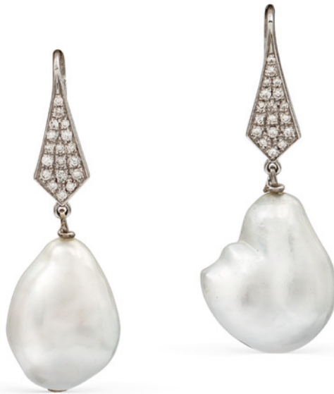
213 ORECCHINI IN ORO BIANCO 18KT E PERLE SCARAMAZZE PENDENTI di 16 mm. circa sormontate da diamanti taglio brillante ct 0,35 circa peso 11,9 gr. € 400/600