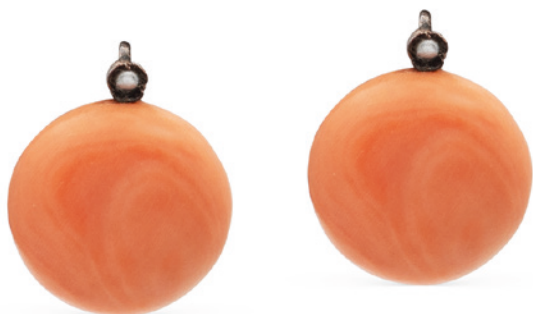
123 ORECCHINI A MONACHINA IN CORALLO primi 900 taglio cabochon montati in oro rosa e argento sormontati da due perline peso gr. 14,5 € 300/400