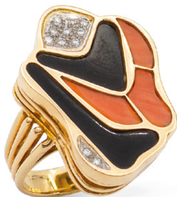
187 ANELLO SCULTURA IN ORO GIALLO 18KT CON CORALLO E ONICE NERO bollo Francia, anni 70/80 tagliati a sezioni fantasia e diamanti taglio brillante, misura 14 peso 14,4 gr. € 1.200/1.500