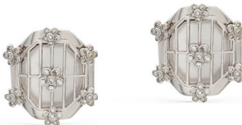
171 ORECCHINI IN ORO BIANCO 18KT, CRISTALLO DI ROCCA E DIAMANTI taglio brillante disposti a motivo floreale peso 10,3 gr. € 300/400