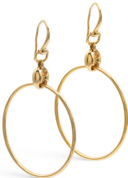
25 GUCCI, ORECCHINI COLLEZIONE MARINA CHAIN cerchi pendenti in oro giallo 18kt, firmati sul retro peso 6,1 gr. € 200/400