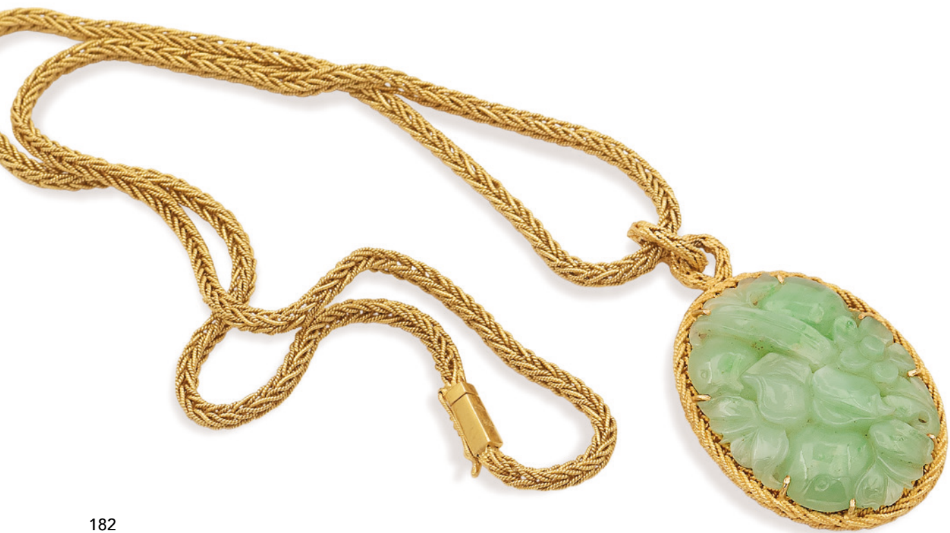
182 PENDENTE IN GIADA SCOLPITA A MOTIVO FLOREALE incastonata entro cornice, collana in oro giallo 18kt lavorato a cordoncino, lunghezza 55 cm. peso 46,4 gr. € 1.500/1.800