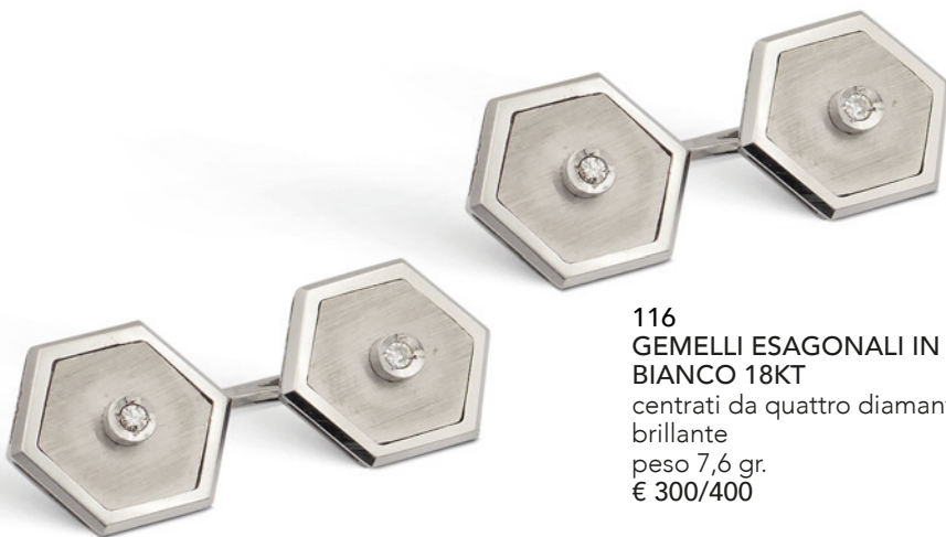
116 GEMELLI ESAGONALI IN ORO BIANCO 18KT centrati da quattro diamanti taglio brillante peso 7,6 gr. € 300/400