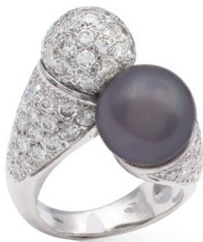
11 ANELLO CONTRARIÉ IN ORO BIANCO 18KT con una perla Tahiti di 10 mm. e sfera di diamanti taglio brillante ct 3 circa, misura 13 peso 19,9 gr. € 1.400/1.800