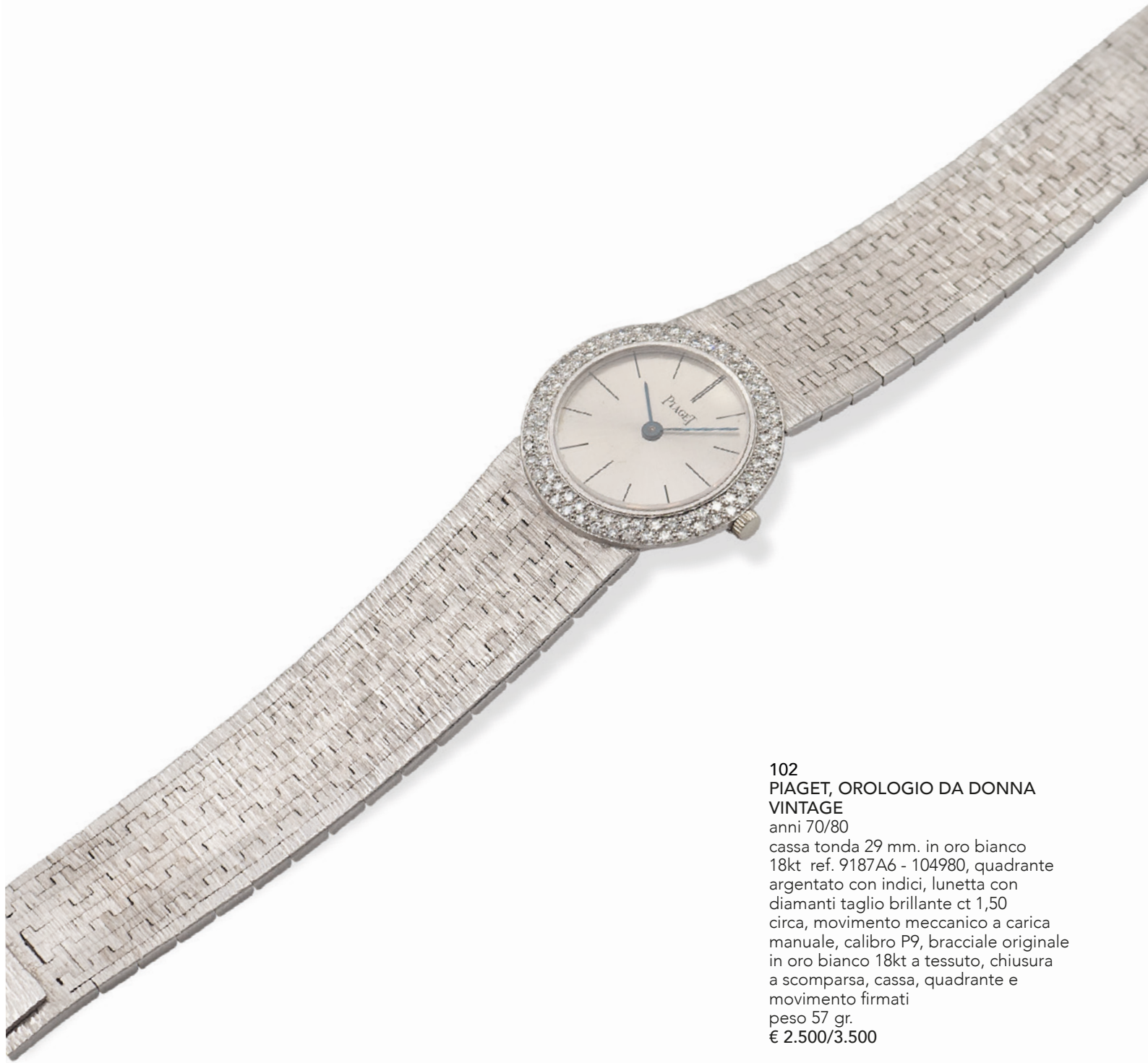
102 PIAGET, OROLOGIO DA DONNA VINTAGE anni 70/80 cassa tonda 29 mm. in oro bianco 18kt ref. 9187A6 - 104980, quadrante argentato con indici, lunetta con diamanti taglio brillante ct 1,50 circa, movimento meccanico a carica manuale, calibro P9, bracciale originale in oro bianco 18kt a tessuto, chiusura a scomparsa, cassa, quadrante e movimento firmati peso 57 gr. € 2.500/3.500