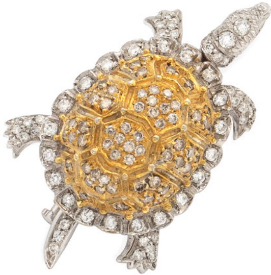
1 SPILLA TARTARUGA IN ORO BIANCO E GIALLO 18KT E DIAMANTI taglio brillante ct 2 circa, testa e coda snodabili peso 15,9 gr. € 1.000/1.500