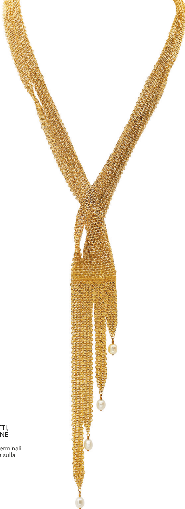
56 TIFFANY & CO. BY ELSA PERETTI, COLLANA SCIARPA COLLEZIONE MESH in oro giallo 18kt maglia a rete, terminali con perle di acqua dolce, firmata sulla targhetta, lunghezza 64 cm. Completa di astuccio e scatola peso 29,9 gr. € 1.000/1.500