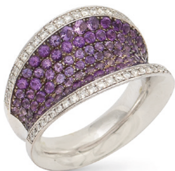
14 CHOPARD, ANELLO IN ORO BIANCO 18KT fascia centrale con pavé di ametiste, ai lati riviere di diamanti taglio brillante ct 0,60 circa, firmato e numerato all'interno n. 3257448 - 827861 misura 13,5 Completo di scatola peso 14,6 gr. € 1.000/1.500