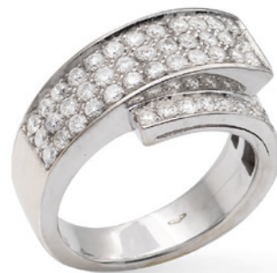
23 ANELLO A MOTIVO CONTRARIÉ IN ORO BIANCO E DIAMANTI taglio brillante ct 1,20 circa, misura 11,5 peso 9,2 gr. € 600/900