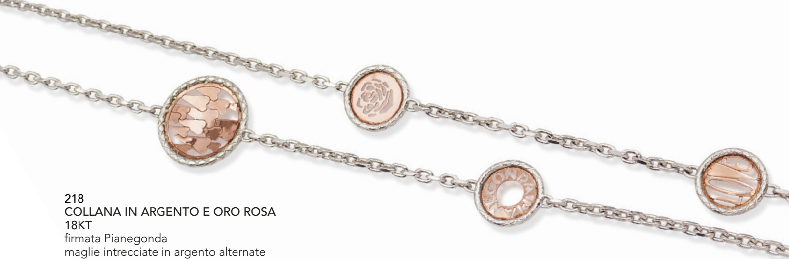
218 COLLANA IN ARGENTO E ORO ROSA 18KT firmata Pianegonda maglie intrecciate in argento alternate da elementi circolari in oro rosa con cuori, fiori, love e logo, lunghezza 95 cm. peso 52 gr. € 200/300