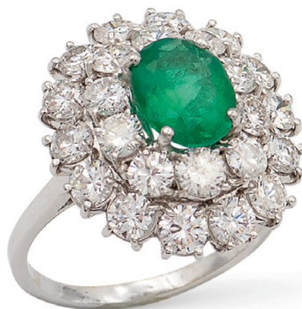
55 ANELLO CON SMERALDO NATURALE COLUMBIA CT 1,49 montato in oro bianco 18kt e diamanti taglio brillante ct 2,50 circa, misura 15,5 Completo di certificato gemmologico C. Dunaigre Switzerland n. CDC 2002126 peso 6,8 gr. € 3.500/4.500