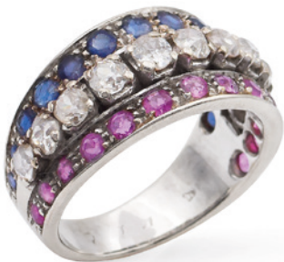
147 ANELLO IN ORO BIANCO 18KT anni 40/50 rivièrè centrale con diamanti taglio brillante antico ct 0,80, circa ai lati rubini e zaffiri tondi, misura 18 peso 9,3 gr. € 600/900