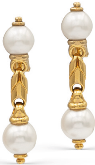
84 BULGARI, ORECCHINI COLLEZIONE PARENTESI in oro giallo 18kt con quattro perle coltivate disposte a gradazione da 8,5 mm. a 9,5 mm. firmati sulla clips peso 14,8 gr. € 1.700/2.000