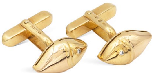
87 BULGARI, GEMELLI PESCI COLLEZIONE NATURALIA in oro giallo 18kt, negli occhi incastonati due diamanti taglio brillante, firmati su un lato. Completi di scatola peso 11,9 gr. € 600/800