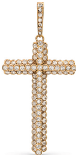
93 CARTIER, PENDENTE CROCE IN ORO GIALLO 18KT diamanti taglio brillante ct 1,50 circa, firmato e numerato 33093 sulla maglia peso 5 gr. € 800/1.200