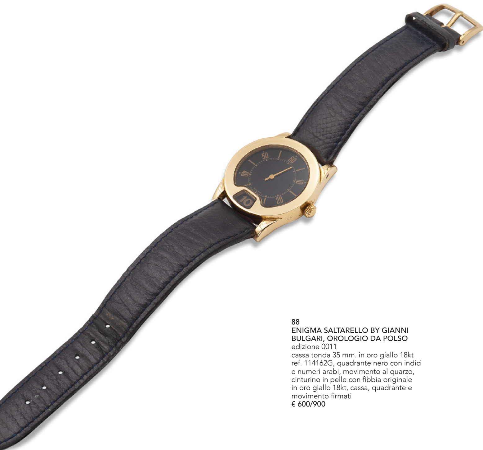
88 ENIGMA SALTARELLO BY GIANNI BULGARI, OROLOGIO DA POLSO edizione 0011 cassa tonda 35 mm. in oro giallo 18kt ref. 114162G, quadrante nero con indici e numeri arabi, movimento al quarzo, cinturino in pelle con fibbia originale in oro giallo 18kt, cassa, quadrante e movimento firmati € 600/900