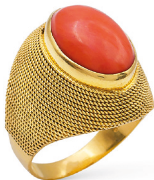
207 ANELLO IN ORO GIALLO 18KT E CORALLO ROSSO anni 50/60 taglio cabochon, misura 12 peso 7,9 gr. € 300/400