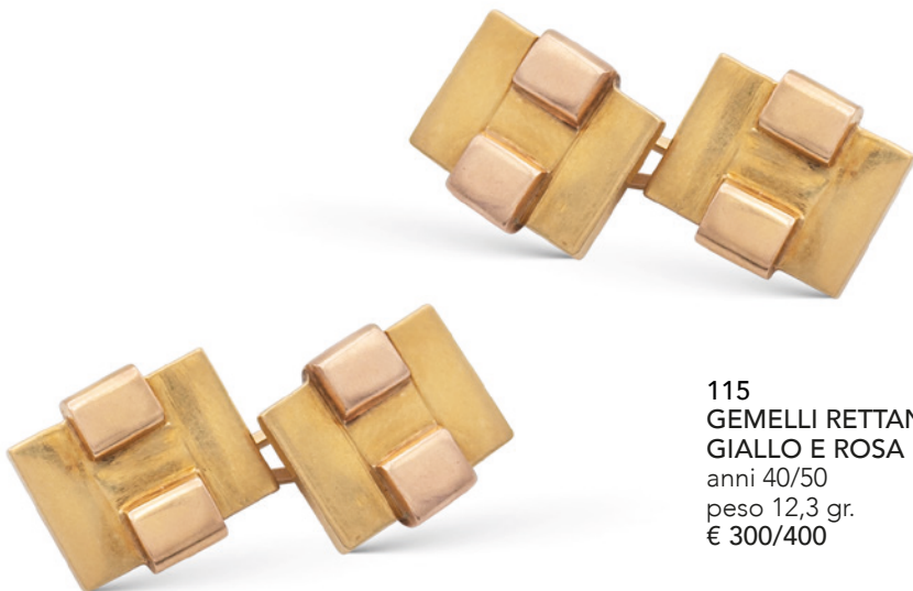
115 GEMELLI RETTANGOLARI IN ORO GIALLO E ROSA 18KT anni 40/50 peso 12,3 gr. € 300/400