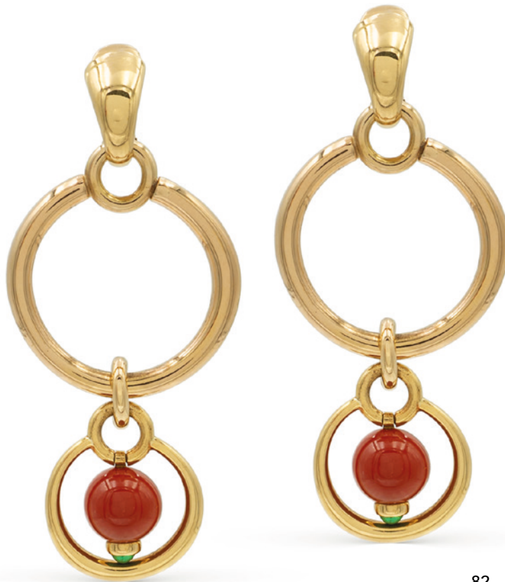
82 BULGARI, ORECCHINI IN ORO GIALLO 18KT E CORALLO anni 90 circa cerchi intrecciati a gradazione, due sfere pendenti in corallo rosso con castonature di smeraldi taglio cabochon, firmati sulla clips Completi di scatola peso 33 gr. € 2.000/3.000