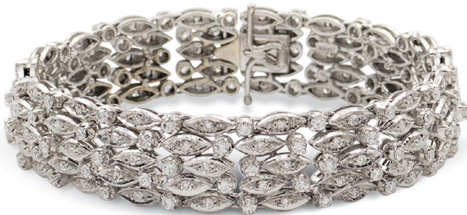
214 BRACCIALE IN ORO BIANCO 18KT E DIAMANTI anni 50/60 taglio huit-huit ct 6,50 circa, chiusura a scomparsa, lunghezza 17,5 cm. peso 37,2 gr. € 1.500/2.000