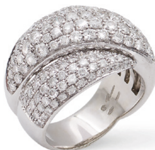
46 ANELLO A TORCHON IN ORO BIANCO 18KT E DIAMANTI taglio brillante ct 3 circa, misura 20 peso 15 gr. € 1.400/1.800