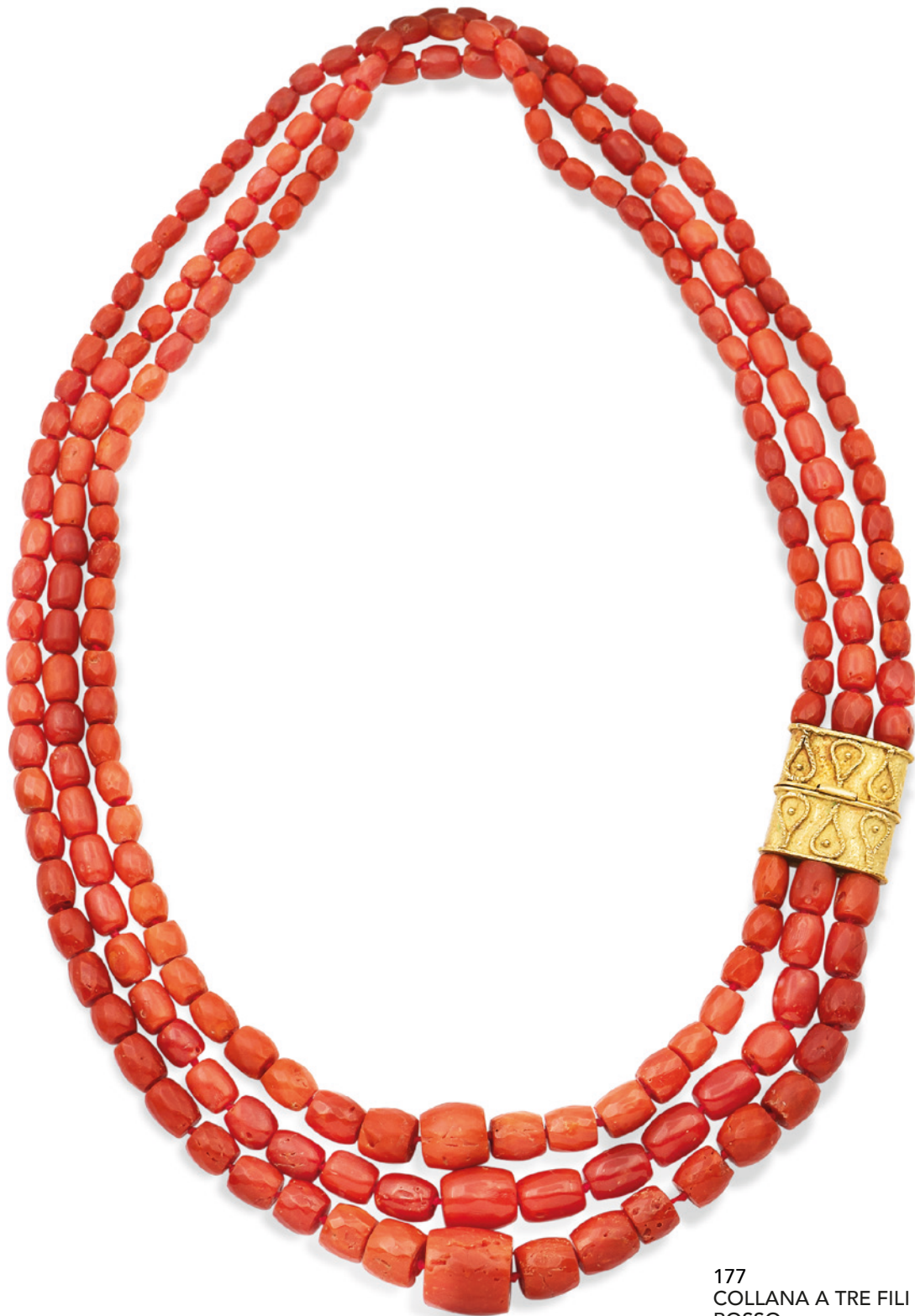
177 COLLANA A TRE FILI DI CORALLO ROSSO firmata Marco Bicego tagliato a barilotti disposti a gradazione da 6 mm. a 15 mm. chiusura laterale a scomparsa in oro giallo 18kt, lunghezza 52 cm. peso 140 gr. € 800/1.000