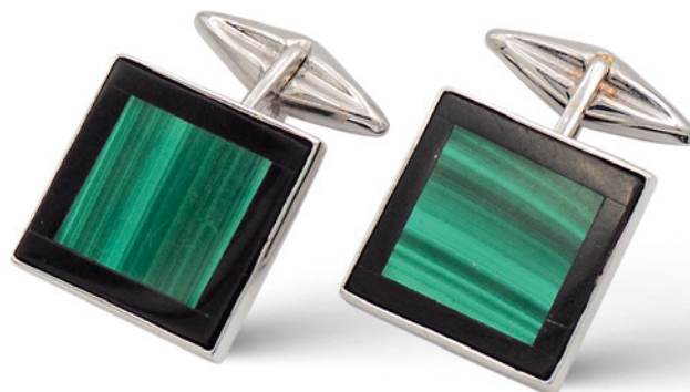
117 GEMELLI SQUADRATI IN ORO BIANCO 18KT MALACHITE E ONICE NERO peso 11,5 gr. € 400/600