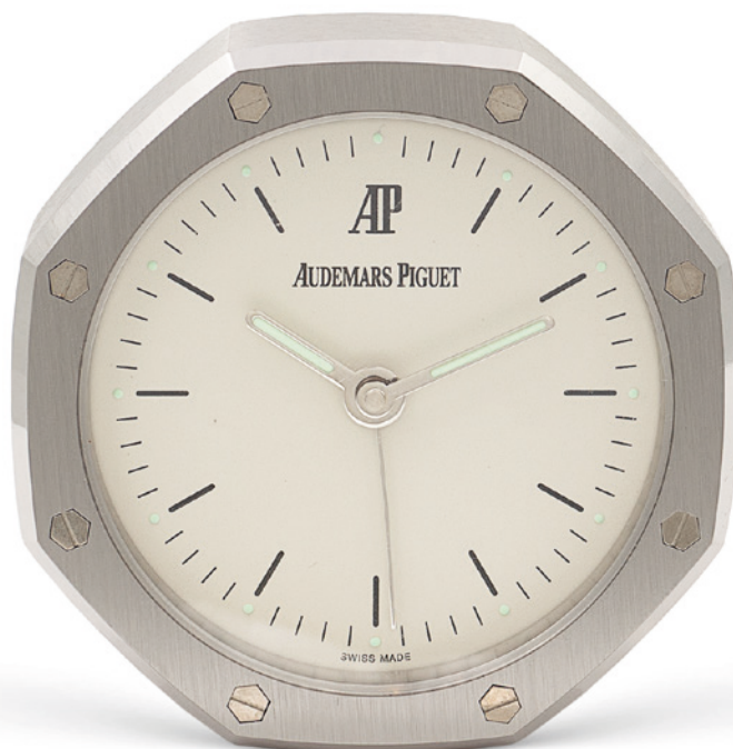
99 AUDEMARS PIGUET ROYAL OAK, OROLOGIO SVEGLIA DA TAVOLO anno 2007 cassa ottagonale in acciaio 6,5 cm. quadrante bianco con indici fluorescenti, movimento al quarzo Completo di scatola € 300/500