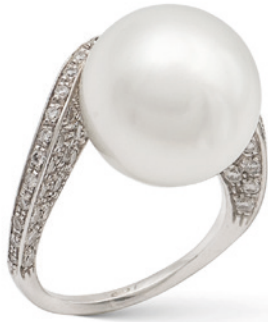
22 ANELLO IN ORO BIANCO 18KT CON PERLA COLTIVATA di 13,5 mm. ai lati diamanti taglio brillante ct 0,60 circa, misura 10 peso gr. 7,9 € 700/1.000