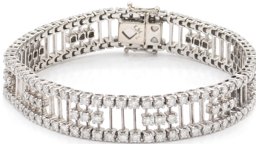
170 BRACCIALE IN ORO BIANCO 18KT E DIAMANTI taglio brillante ct 6,50 circa, chiusura a scomparsa, lunghezza 18 cm. peso 29,8 gr. € 3.000/4.000