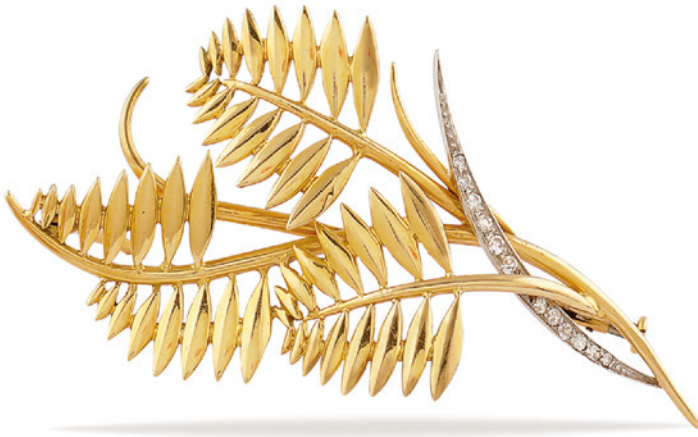
150 PARURE SPILLA E ORECCHINI A FORMA DI FOGLIE anni 40/50 in oro giallo 18kt e platino e diamanti taglio brillante antico ct 0,20 circa, chiusura a clip peso 19,8 gr. € 400/600