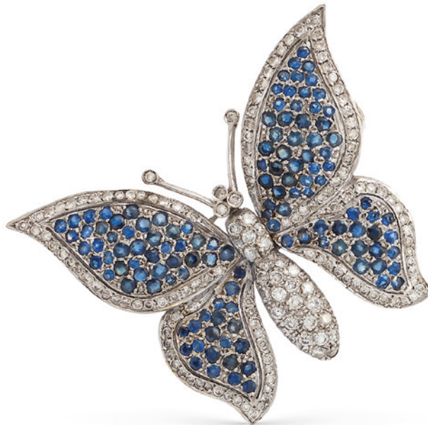
4 SPILLA FARFALLA IN ORO BIANCO 18KT CON ZAFFIRI E DIAMANTI taglio brillante ct 2 circa alternati da zaffiri tondi ct 2,50 circa peso 25,5 gr. € 1.000/1.500