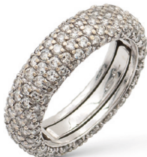
54 ANELLO FEDE IN ORO BIANCO 18KT E PAVÉ DI DIAMANTI taglio brillante ct 3 circa, misura 13 peso 5,2 gr. € 1.200/1.500