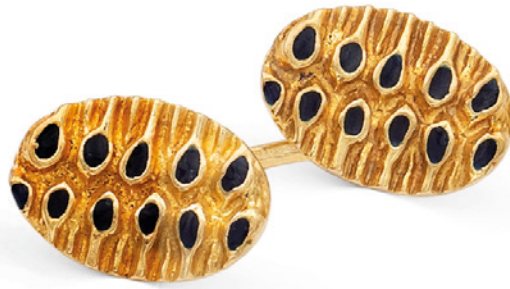
119 GEMELLI OVALI IN ORO GIALLO 18KT decorati con smalto blu peso 10,4 gr. € 300/400