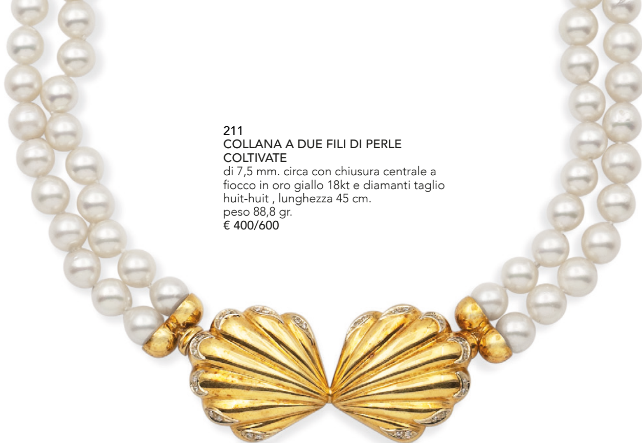
211 COLLANA A DUE FILI DI PERLE COLTIVATE di 7,5 mm. circa con chiusura centrale a fiocco in oro giallo 18kt e diamanti taglio huit-huit , lunghezza 45 cm. peso 88,8 gr. € 400/600