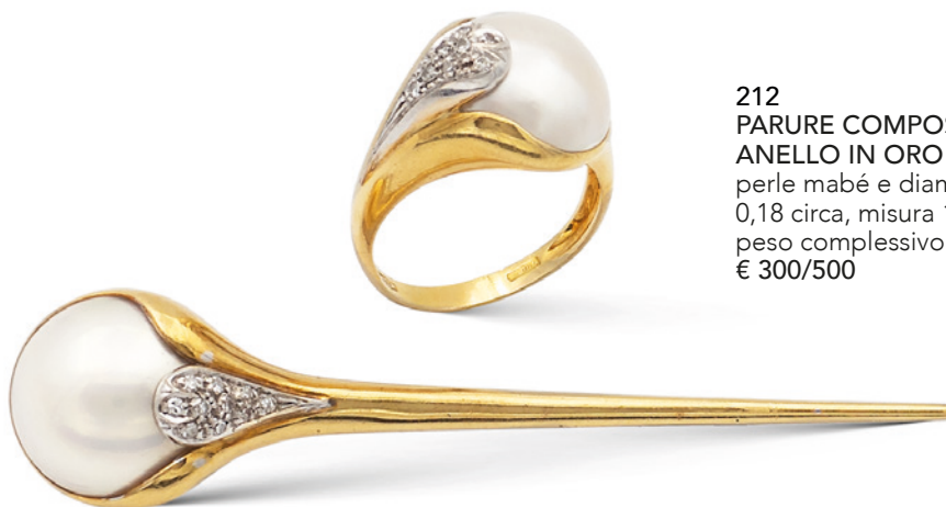
212 PARURE COMPOSTA DA SPILLA ED ANELLO IN ORO GIALLO 18KT perle mabé e diamanti taglio brillante ct 0,18 circa, misura 15,5 peso complessivo 16,9 gr. € 300/500