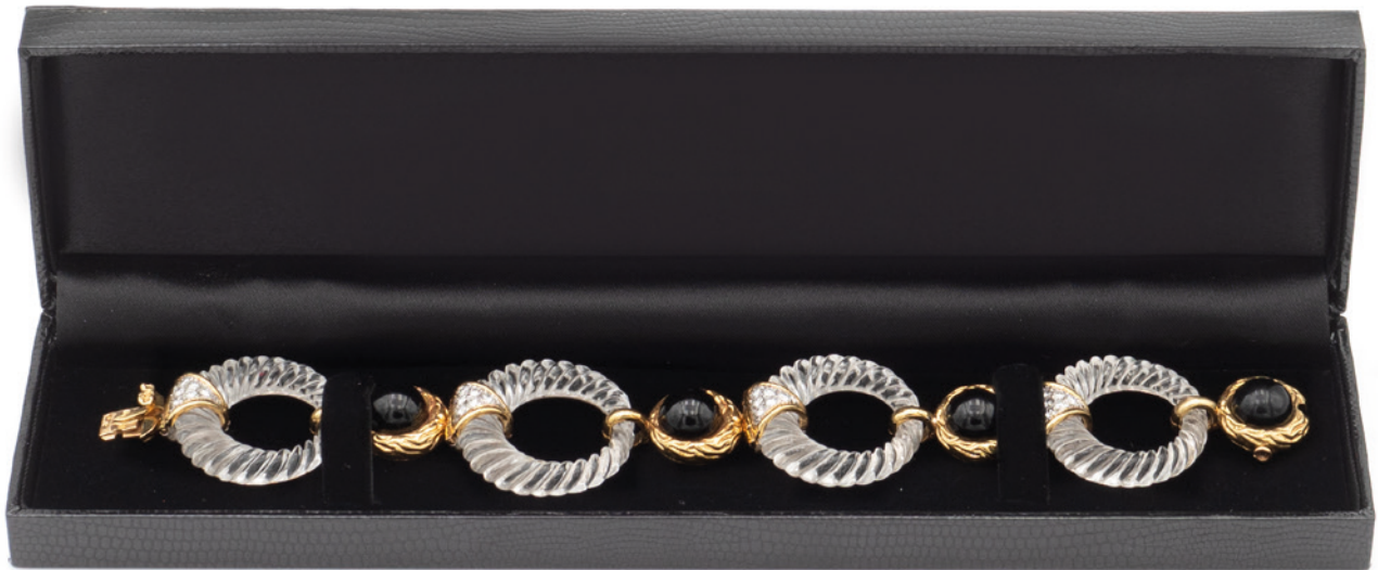
59 BOUCHERON PARIS, BRACCIALE IN ORO GIALLO 18KT E CRISTALLO DI ROCCA bolli Francia di forma circolare tagliato a torchon, alternato da elementi in oro giallo con castonature di onice nero taglio cabochon e diamanti taglio brillante ct 1 circa, chiusura a scomparsa, firmato sulla chiusura, lunghezza 17 cm. peso 63,8 gr. € 5.000/7.000