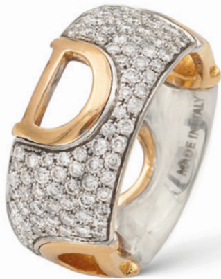
35 DAMIANI, ANELLO COLLEZIONE D. ICON fascia in oro bianco e rosa 18kt con logo impreziosito da diamanti taglio brillante ct 2 circa, firmato all'interno, misura 14 Completo di scatola peso 8,8 gr. € 1.200/1.600