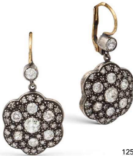
125 ORECCHINI A MONACHINA IN ORO GIALLO E ARGENTO CON ROSE DI DIAMANTE primi '900 ct 3 circa disposte a motivo floreale peso 8,9 gr. € 2.800/3.500