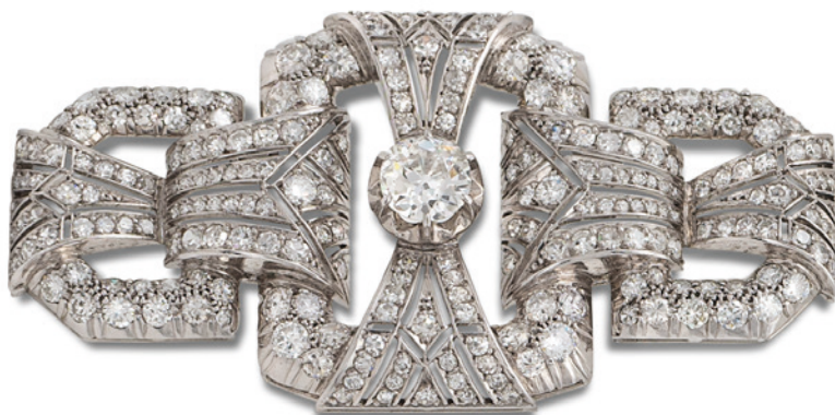
142 SPILLA A MOTIVO GEOMETRICO IN ORO BIANCO 18KT E DIAMANTI anni 40/50 centrata da un diamante taglio brillante antico ct 0,75 circa contornata da diamanti taglio brillante ct 2,50 circa peso 20,1 gr. € 1.200/1.500