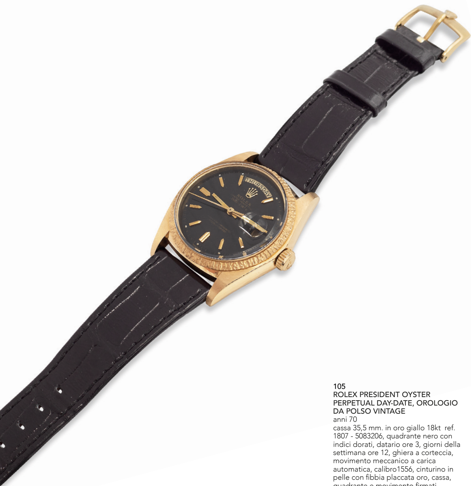
105 ROLEX PRESIDENT OYSTER PERPETUAL DAY-DATE, OROLOGIO DA POLSO VINTAGE anni 70 cassa 35,5 mm. in oro giallo 18kt ref. 1807 - 5083206, quadrante nero con indici dorati, datario ore 3, giorni della settimana ore 12, ghiera a corteccia, movimento meccanico a carica automatica, calibro 1556, cinturino in pelle con fibbia placcata oro, cassa, quadrante e movimento firmati € 3.000/4.000