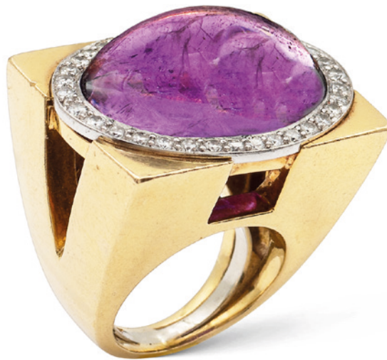
61 DAVID WEBB, ANELLO A PONTE IN ORO GIALLO E BIANCO 18KT E AMETISTA taglio ovale cabochon contornata da diamanti taglio brillante ct 0,60 circa, firmato all'interno del gambo, misura 12 peso 32,6 gr. € 4.000/6.000