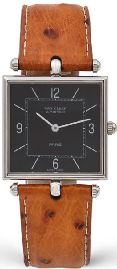
98 VAN CLEEF & ARPELS, OROLOGIO DA POLSO VINTAGE anni 90 cassa carré in acciaio 26 mm. ref. 053142 - 11590, quadrante nero con indici e numeri arabi, movimento al quarzo, cinturino in pelle con fibbia originale in acciaio, cassa, quadrante e movimento firmati € 400/600