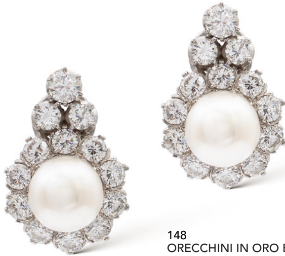
148 ORECCHINI IN ORO BIANCO 18KT, DIAMANTI E PERLE COLTIVATE anni 50/60 di 9 mm. circa contornate da diamanti taglio brillante ct 3,50 circa peso 16,2 gr. € 1.500/2.000