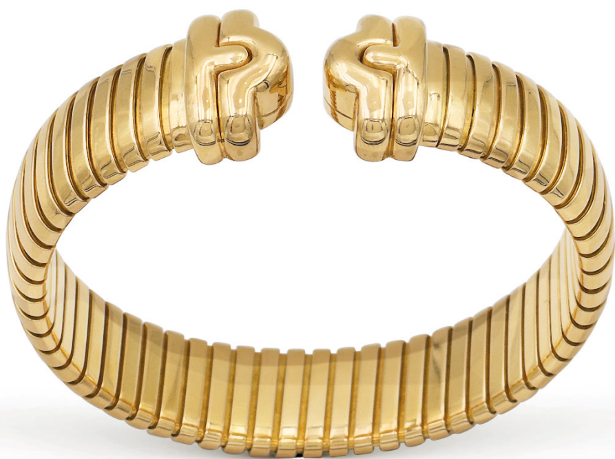
86 BULGARI, BRACCIALE TUBOGAS COLLEZIONE PARENTESI in oro giallo 18kt, maglia tubogas con terminali, firmato all'interno, diametro 6 cm. Completo di scatola peso 75,3 € 4.000/6.000