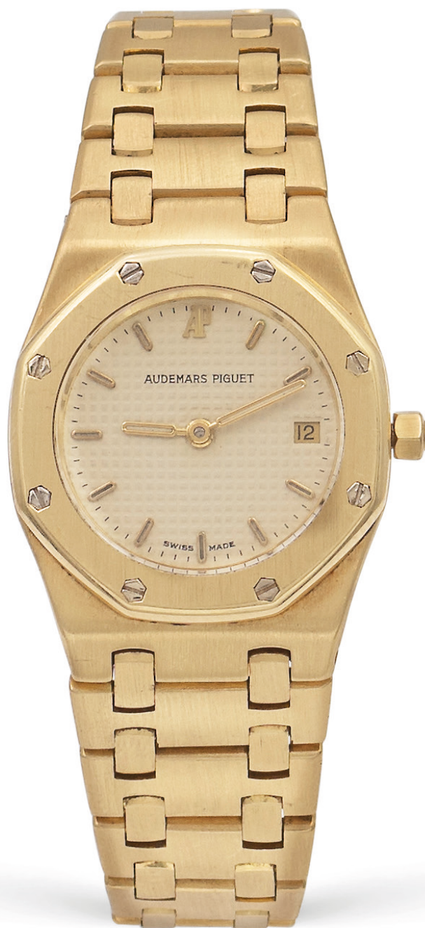
100 AUDEMARS PIGUET ROYAL OAK, OROLOGIO DA DONNA anni 90 cassa tonda 26 mm. in oro giallo 18kt ref. C80245 - 1668, quadrante dorato con indici, datario ore 3, vetro zaffiro, movimento al quarzo, bracciale originale in oro giallo 18kt con chiusura deployante peso 78,9 gr. € 3.000/4.000