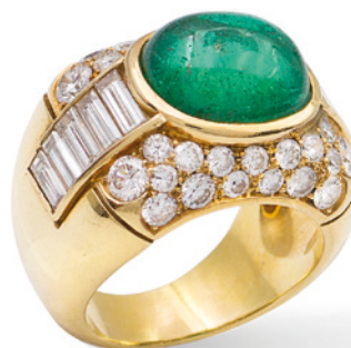
66 ANELLO IN ORO GIALLO 18KT CON SMERALDO NATURALE CT 4,80 firmato Pasquali Roma circa taglio cabochon, ai lati diamanti taglio baguette ct 2,80 circa colore F/G - purezza IF/VS e diamanti taglio brillante ct 1,80 circa colore F/G - purezza IF/ VVS, misura 13 Completo di certificato gemmologico I.G.N. n. 29006 peso 18 gr. € 3.000/5.000