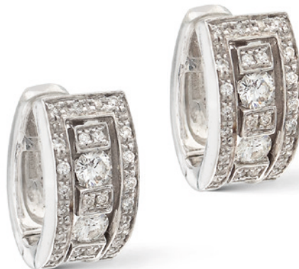
36 DAMIANI, ORECCHINI COLLEZIONE BELLE EPOQUE semicerchi in oro bianco 18kt e diamanti taglio brillante ct 0,80 circa, firmati all'interno Completi di scatola peso 10 gr. € 600/900