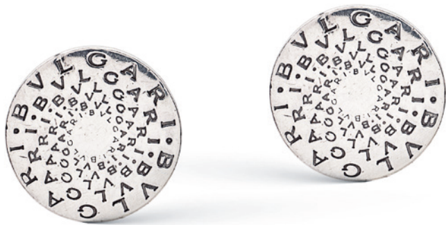
78 BULGARI, ORECCHINI IN ARGENTO di forma circolare con monogramma Bulgari inciso, completi di scatola peso 13,9 gr. € 200/400