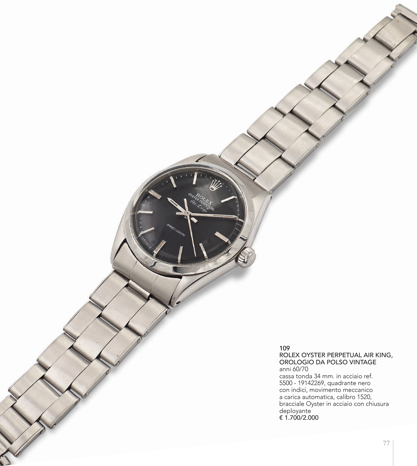
109 ROLEX OYSTER PERPETUAL AIR KING, OROLOGIO DA POLSO VINTAGE anni 60/70 cassa tonda 34 mm. in acciaio ref. 5500 - 19142269, quadrante nero con indici, movimento meccanico a carica automatica, calibro 1520, bracciale Oyster in acciaio con chiusura deployante € 1.700/2.000