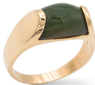
83 BULGARI, ANELLO COLLEZIONE TRONCHETTO in oro giallo 18kt e peridoto taglio fantasia, firmato all'interno del gambo, misura 24 Completo di scatola peso 8,9 gr. € 700/1.000