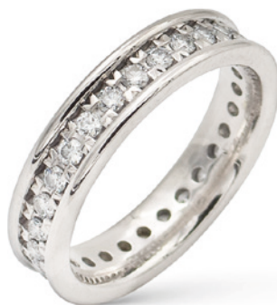
15 CHOPARD, ANELLO FEDE COLLEZIONE TIMELESS realizzata in platino e diamanti taglio brillante ct 0,70 circa, firmato e numerato all'interno n. 6258964 - 827338-9108 misura 11 Completo di scatola peso 6,5 gr. € 800/1.200