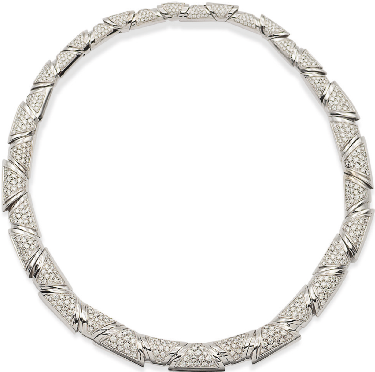
47 COLLIER IN ORO BIANCO 18KT E DIAMANTI taglio brillante ct 12 circa disposti a motivo geometrico, chiusura a cofanetto a scomparsa, lunghezza 43 cm. peso 97 gr. € 4.000/6.000