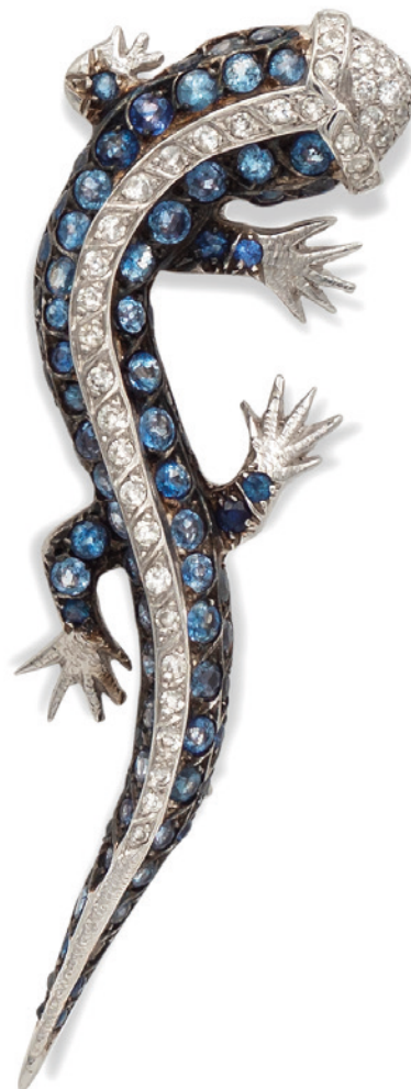
6 SPILLA GECO IN ORO BIANCO 18KT CON ZAFFIRI E DIAMANTI ct 4 circa alternati da diamanti taglio brillante ct 1 circa peso 21 gr. € 1.000/1.500