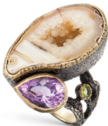
198 ANELLO SCULTURA IN ORO GIALLO E ARGENTO CON AGATA NATURALE anni 70/80 ametista taglio a goccia briolet e un peridoto tondo, misura 16,5 peso 39,2 gr. € 600/900