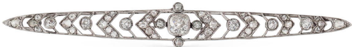
126 SPILLA BARRETTA IN PLATINO E DIAMANTI primi '900 centrata da un diamante taglio a cuscino ct 0,50 circa, ai lati diamanti taglio brillante antico e rose di diamante ct 0,80 circa peso 7 gr. € 800/1.200