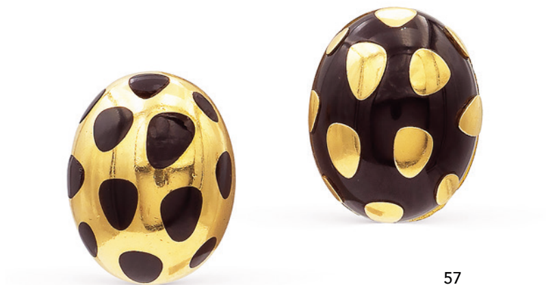
57 TIFFANY & CO. ORECCHINI IN ORO GIALLO 18KT E ONICE NERO anni 70/80 tagliato a sezioni fantasia, firmati sul retro, uno lievi difetti peso 19,3 gr. € 2.000/3.000