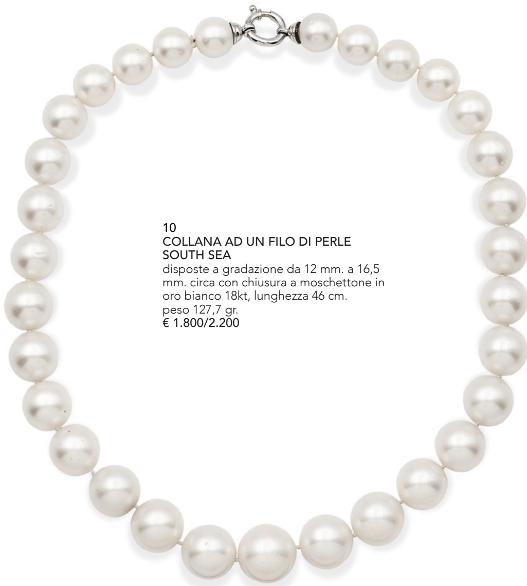
10 COLLANA AD UN FILO DI PERLE SOUTH SEA disposte a gradazione da 12 mm. a 16,5 mm. circa con chiusura a moschettone in oro bianco 18kt, lunghezza 46 cm. peso 127,7 gr. € 1.800/2.200