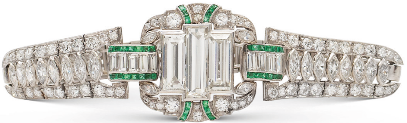
134 BRACCIALE DECÒ IN PLATINO, DIAMANTI E SMERALDI centrato da tre diamanti taglio baguette ct 4 circa, ai lati elementi a ponte con diamanti taglio baguettes, brillante e marquise ct 4 circa alternati da smeraldi taglio carré, chiusura a scomparsa, lunghezza 16 cm. peso 27,5 gr. € 4.000/6.000