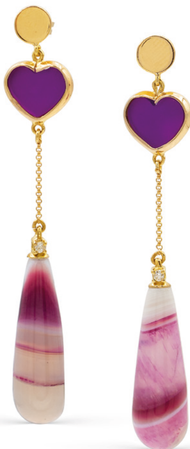
196 ORECCHINI PENDENTI IN ORO GIALLO 18KT cuori in calcedonio viola con due agate variegate pendenti sormontate da due diamanti taglio brillante peso 12,5 gr. € 300/400