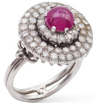
146 ANELLO IN ORO BIANCO 18KT CON RUBINO CABOCHON E DIAMANTI anni 40/50 taglio brillante antico ct 1 circa, misura 16, rubino con difetti peso 12 gr. € 800/1.000