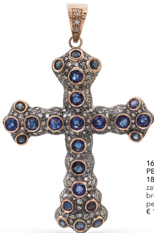
162 PENDENTE CROCE IN ORO ROSA 18KT E ARGENTO zaffiri tondi ct 7 circa e diamanti taglio brillante ct 2,80 circa peso 32 gr. € 1.400/1.800