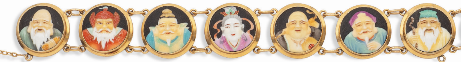
206 BRACCIALE IN ORO GIALLO CON PLACCHE IN RESINA NOVELTY manifattura orientale raffiguranti I Sette Saggi, lunghezza 17,5 cm. peso 44,1 gr. € 1.700/2.000