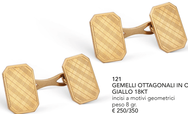
121 GEMELLI OTTAGONALI IN ORO GIALLO 18KT incisi a motivi geometrici peso 8 gr. € 250/350