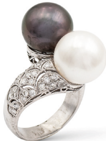
149 ANELLO CONTRARIÉ IN IN ORO BIANCO 18KT E DUE PERLE COLTIVATE anni 40/50 rispettivamente bianca e tahiti di 12 mm. e 11 mm. ai lati diamanti taglio brillante ct 0,80 circa, misura 14 peso 13,3 gr. € 1.700/2.000