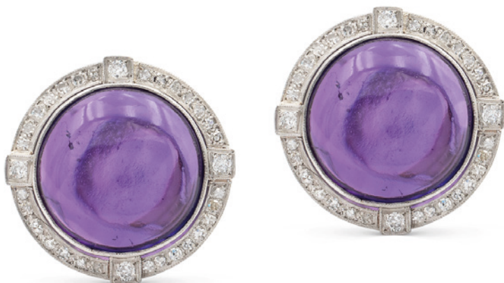
141 ORECCHINI IN PLATINO CON AMETISTE TAGLIO CABOCHON anni 40/50 contornate da diamanti taglio brillante antico ct 1 circa peso 33,8 gr. € 1.300/1.600