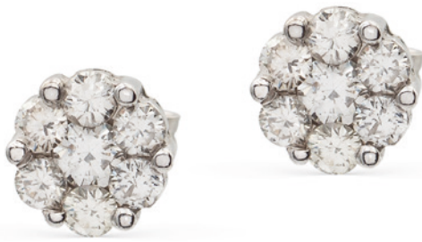
168 ORECCHINI IN ORO BIANCO 18KT E DIAMANTI taglio brillante ct 1,30 circa disposti a motivo floreale peso 3,6 gr. € 700/1.000