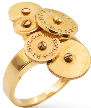
81 BULGARI, ANELLO COLLEZIONE CYCLADES realizzato in oro giallo 18kt, misura 13 peso 9,5 gr. € 500/700