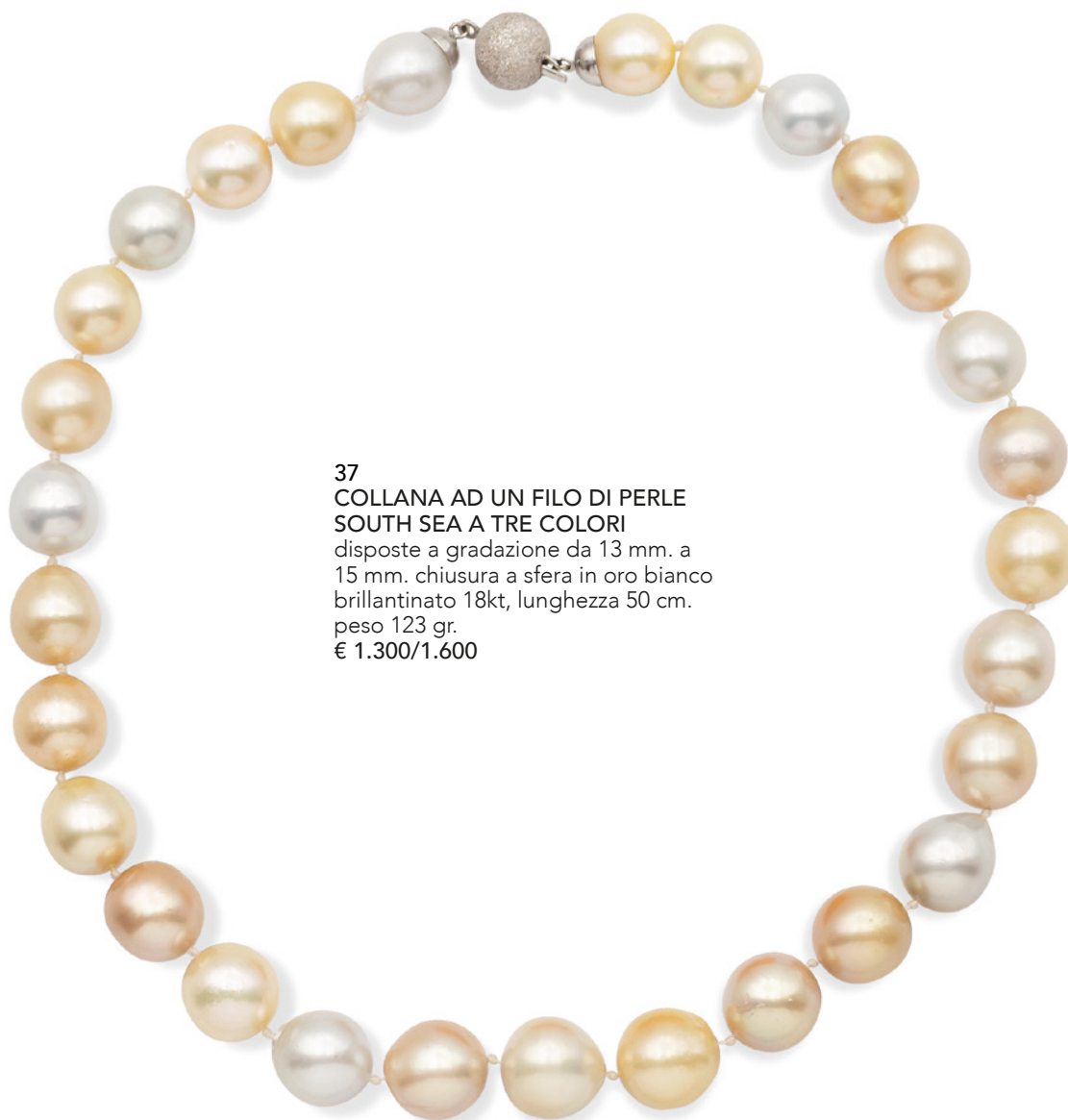
37 COLLANA AD UN FILO DI PERLE SOUTH SEA A TRE COLORI disposte a gradazione da 13 mm. a 15 mm. chiusura a sfera in oro bianco brillantato 18kt, lunghezza 50 cm. peso 123 gr. € 1.300/1.600