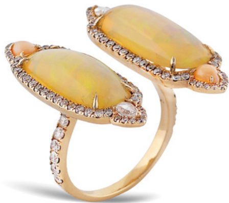
156 ANELLO IN ORO ROSA 18KT CON DUE OPALI ARLECCHINO anni 50/60 taglio cabochon rettangolare contornati da diamanti taglio huit-huit, due diamanti taglio briolet ct 1 circa e due piccoli coralli rosa a goccia, misura regolabile peso 8 gr. € 800/1.200