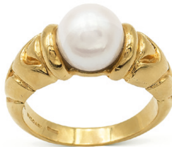
85 BULGARI, ANELLO COLLEZIONE PARENTESI in oro giallo 18kt con perla coltivata di 8,5 mm. firmato all'interno del gambo, misura 16 peso 9,2 gr. € 1.200/1.500